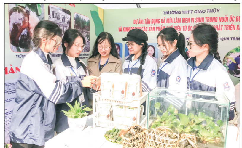
Dự án "Tận dụng bã mía làm men vi sinh trong nuôi ốc bươu đen và kinh doanh các sản phẩm chế biến từ ốc, góp phần phát triển kinh tế tuần hoàn" của Trường THPT Giao Thủy (Giao Thủy) đoạt giải Nhất tại Ngày hội khởi nghiệp và cuộc thi "Học sinh phổ thông với ý tưởng khởi nghiệp" tỉnh Nam Định lần thứ 2.

Kết quả đánh giá các dự án tại các cuộc thi khởi nghiệp đã khẳng định thành công bước đầu của ngành GD và ĐT tỉnh và các CSGD trong phong trào khởi nghiệp. Đây sẽ là động lực để các nhà trường tiếp tục nuôi dưỡng các ý tưởng sáng tạo, đồng góp tích cực vào sự phát triển kinh tế, giáo dục và xã hội của tỉnh. Qua các cuộc thi khởi nghiệp, các nhà trường cũng có thêm cơ hội để học sinh trải nghiệm các hoạt động khám phá năng lực, sở trường bản thân - yếu tố cốt lõi để tiếp tục các bước tiếp theo của quá trình định hướng nghề nghiệp. Qua đó, các nhà trường có thể kết nối với doanh nghiệp, tổ chức, cá nhân, thúc đẩy phong trào khởi nghiệp, đổi mới sáng tạo trong nhà trường; tăng cường huy động nguồn lực xã hội cho các hoạt động nghiên cứu, khởi nghiệp; tiếp tục tạo phong trào, sân chơi, môi trường để kích thích, ươm mầm và nuôi dưỡng cho các ý tưởng khởi nghiệp của học sinh; hỗ trợ kinh nghiệm triển khai các hoạt động kết nối các nguồn lực phát triển khởi nghiệp; truyền cảm hứng khởi nghiệp trong HSSV, đảm bảo "học đi đôi với hành" ■