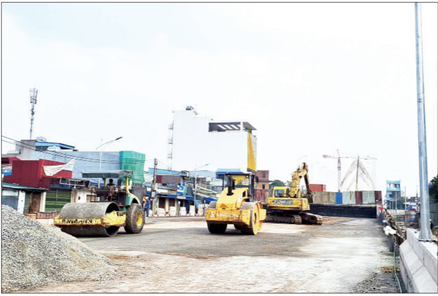
Thi công các hạng mục của Dự án đầu tư xây dựng cầu qua sông Đào nối từ đường Song Hào đến đường Vũ Hữu Lợi.