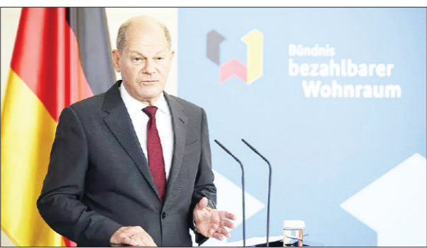
Thủ tướng Đức Olaf Scholz.

Mặc dù ông Merz phủ nhận khả năng liên minh với AfD, nhưng ông Scholz cáo buộc đối thủ "phá vỡ lời hứa" khi chấp nhận ủng hộ từ AfD cho một kiến nghị chống nhập cư tại quốc hội vào cuối tháng