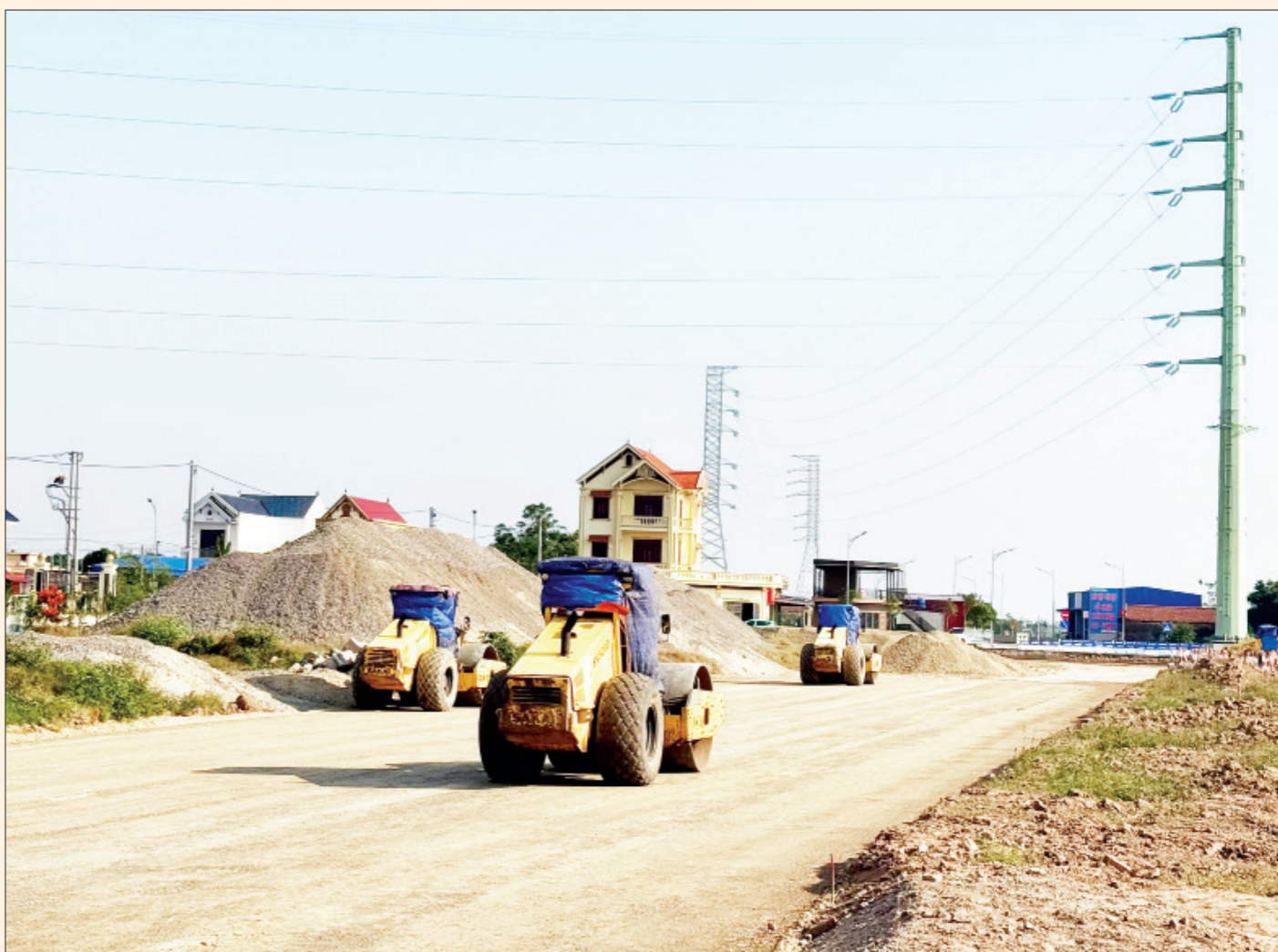
Tuyến đường Nam Định - Lạc Quần - Đường bộ ven biển đang được tăng tốc thi công, góp phần thúc đẩy tiến độ giải ngân vốn đầu tư công năm 2025.

Quán triệt tinh thần chỉ đạo của UBND tỉnh, các sở, ngành, địa phương xác định giải ngân VDTC là nhiệm vụ chính trị quan trọng hàng đầu. Ngay từ khâu lập kế hoạch, các cấp chính quyền, ngành chức năng đã rà soát kỹ lưỡng để đảm bảo phân bổ vốn phù hợp với tiến độ thực hiện của từng dự án. Trong kế hoạch đầu tư công trung hạn giai đoạn 2021-2025 và kế hoạch năm 2025, tỉnh đã điều chỉnh và đưa ra khỏi danh mục đối với các dự án vướng mắc kéo dài trong công tác giải phóng mặt bằng hoặc thủ tục đầu tư, không khả thi; kịp thời bổ sung thêm danh mục các khu đô thị, khu dân cư có tính khả thi cao hơn; từ đó dự kiến được tổng nguồn vốn cho đầu tư phục vụ công tác chỉ đạo, điều hành kế hoạch đầu tư công trung hạn của tỉnh linh hoạt, hiệu quả, sát thực tế. Phân bổ vốn ngân sách tỉnh trực tiếp quản lý, Nam Định ưu tiên tập trung giải ngân VDTC năm 2025 cho các nhiệm vụ (Xem tiếp trang 2)