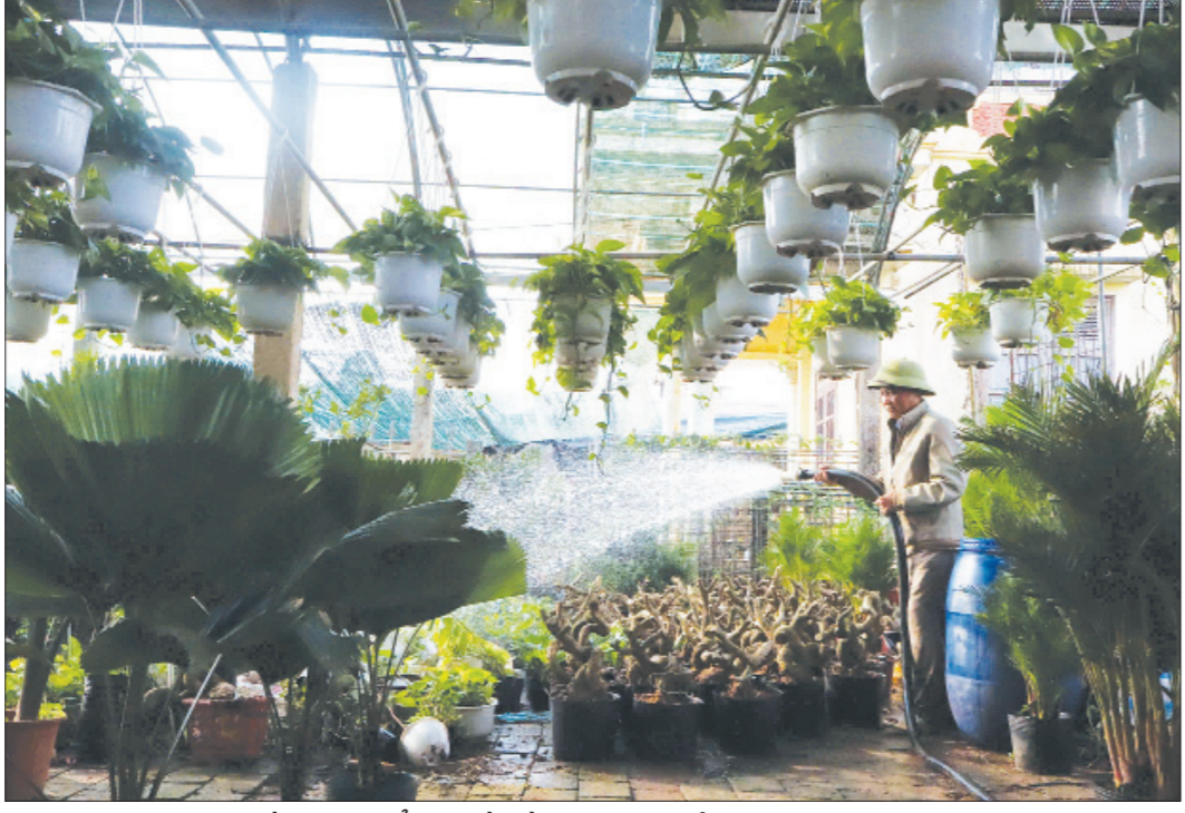
Nông dân xã Nam Điền phát triển nghề trồng hoa cây cảnh.

huyện đã tổ chức được 415 lớp tập huấn và đào tạo nghề cho hơn 25 nghìn giá cả thị trường, đầu ra của sản phẩm, giúp cho việc sản xuất, kinh doanh thuận lợi hơn... Để nhân rộng các mô hình kinh tế tập thể, HND huyện đã tập trung khai thác các nguồn vốn và ưu tiên cho các chi, tổ hội nghề nghiệp vay từ nguồn vốn Quỹ Hỗ trợ nông dân với tổng số tiền trên 1,77 tỷ đồng cho hơn 36 hội viên vay để đầu tư trang thiết bị, phát triển quy mô sản xuất, từ đó hình thành các mô hình kinh tế tập thể làm ăn hiệu quả, giúp người dân ổn định đời sống. Các cấp HND trong huyện cũng đã đẩy mạnh các hoạt động tư vấn, đào tạo nghề, dịch vụ, hỗ trợ nông dân phát triển sản xuất kinh doanh, quảng bá, tiêu thụ nông sản. Hàng năm, HND huyện phối hợp với Trung tâm dạy nghề và Hồ trợ nông dân tỉnh, các cơ quan chuyên môn, công ty, doanh nghiệp trong và ngoài tỉnh tổ chức các lớp tập huấn chuyển giao tiến bộ khoa học kỹ thuật, đào tạo nghề ngắn hạn cho hội viên nông dân. Kết quả trong 5 năm qua, toàn