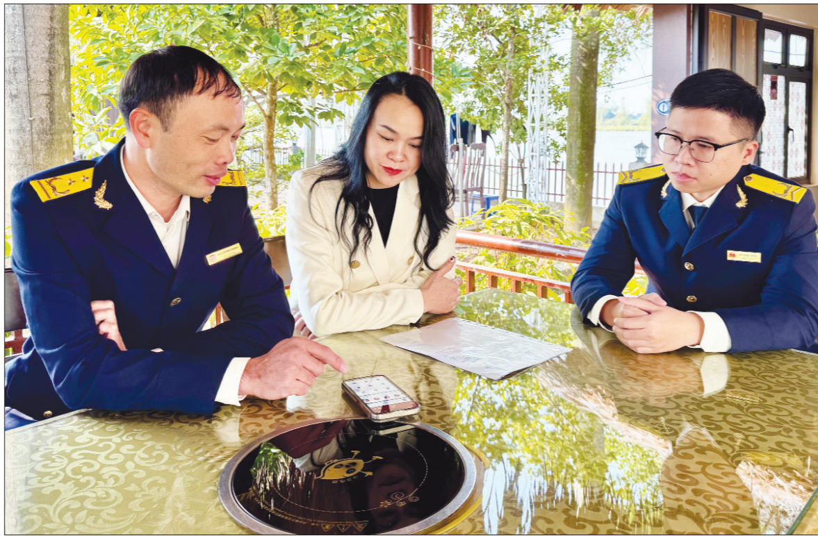
Đội thuế liên xã khu vực Xuân Trường hướng dẫn hộ kinh doanh sử dụng ứng dụng thuế điện tử trên thiết bị di động.

Năm 2024 đánh dấu một bước tiến vượt bậc của Chi cục Thuế khu vực Xuân Thủy khi đạt được những thành tựu đáng tự hào trong công tác thu ngân sách Nhà nước, đóng góp tích cực vào sự phát triển kinh tế - xã hội của tỉnh Nam Định.