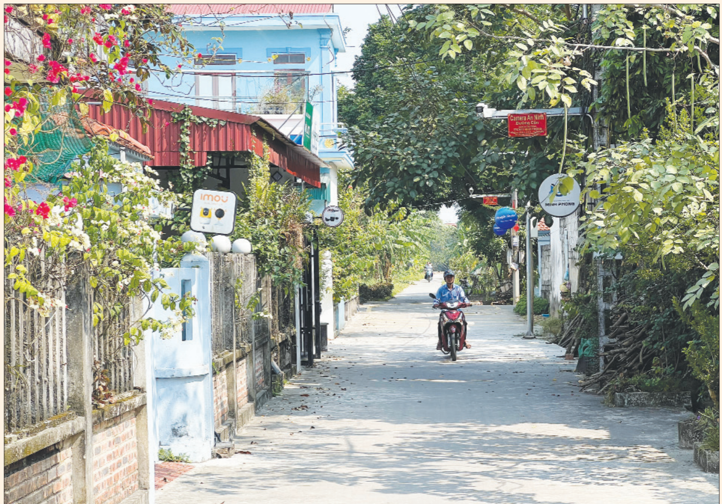
Mô hình camera giám sát an ninh tại thôn thông minh Bo, xã Yên Chính (Ý Yên).