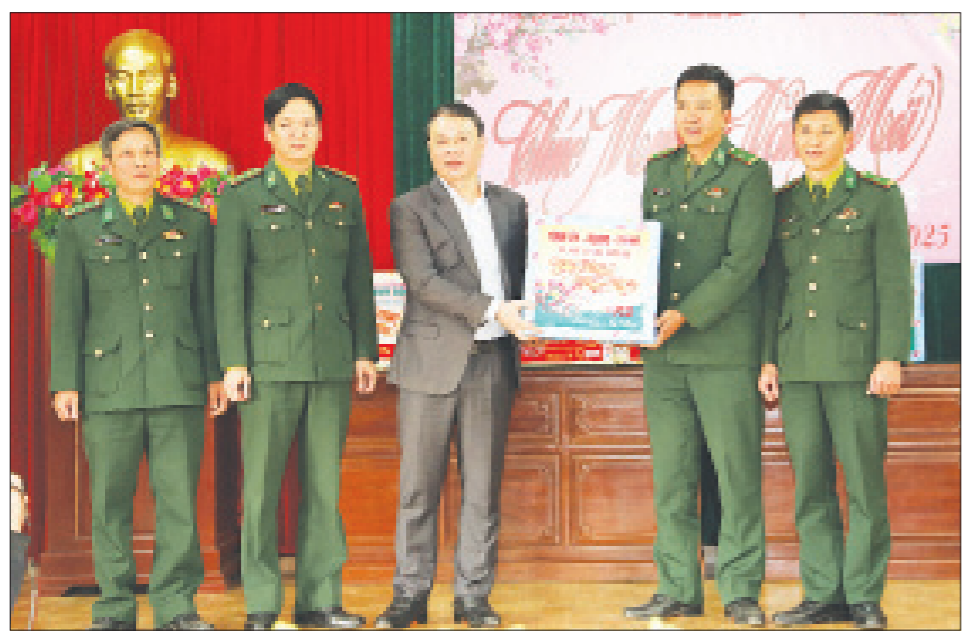
Đồng chí Bí thư Tỉnh ủy Đặng Khánh Toàn tặng quà, chúc Tết cán bộ, chiến sĩ Đồn Biên phòng Ba Lạt và Đồn Biên phòng Quất Lâm.