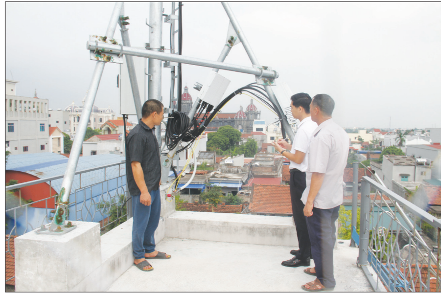
Viettel Nam Định lắp đặt trạm thu phát sóng tại vùng lùm sóng xã Hải Minh (Hải Hậu).