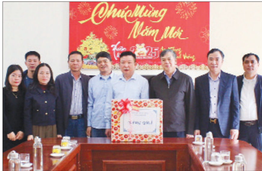
Đồng chí Trần Lê Đòai, TUV, Phó Chủ tịch UBND tỉnh chúc Tết, tặng quà cán bộ, nhân viên, người lao động Trung tâm Bảo trợ xã hội tổng hợp tỉnh.