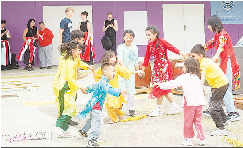
Các bé người Việt hào hứng với các trò chơi dân gian tại "Phiên chợ Tết 2025".

Tại Phiên chợ Tết 2025, một số không gian đặc sắc Tết xưa của người Việt đã được tái hiện như múa sạp, gói bánh chưng, làm hoa đào, hoa mai - những đóa hoa đưa tâm hồn người Việt trở về với lễ hội Tết Việt truyền thống. Trẻ em của cộng đồng người Việt say sưa với các trò chơi dân gian như ô ăn quan và banh dĩa, hay còn gọi là trò chơi chuyên/choi nê, như làm sống lại những mảnh ký ức ngày xưa ở làng quê đồng bằng Bắc Bộ. Gian hàng ẩm thực Việt được bao phủ bởi hương thơm ngào ngạt của bánh chưng, bánh giò, phở Việt, bún thịt nướng..., đã làm dậy lên nỗi nhớ những mâm cơm gia đình đậm đà hương vị Tết. Mỗi chiếc bánh chưng nóng hổi như đưa người Việt trở về với đêm Giao thừa ẩm cúng ngày xưa. Sân khấu của sự kiện tràn