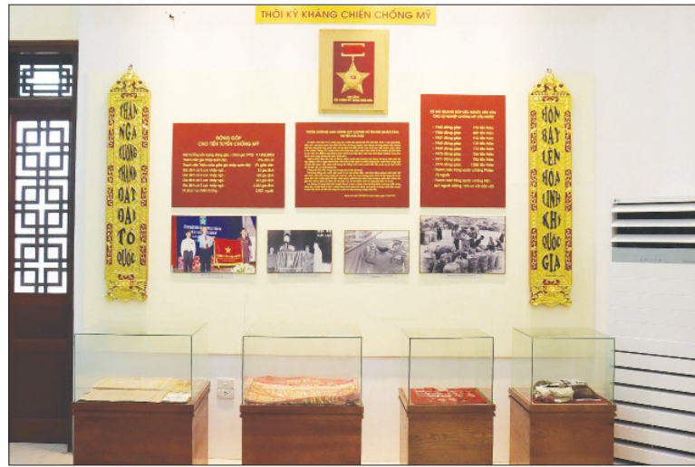
Đôi câu đối trưng bày trong Bảo tàng huyện Hải Hậu.