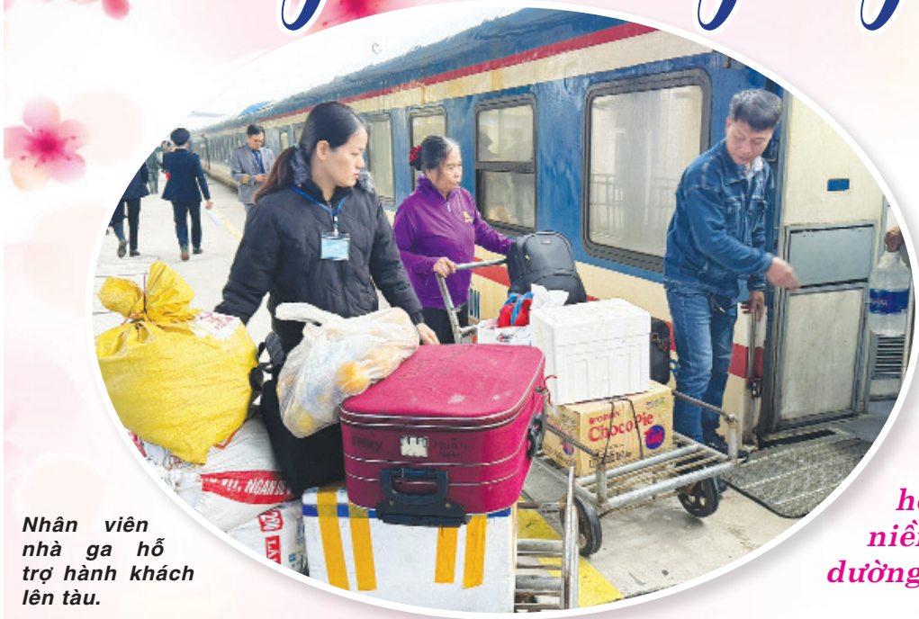
Nhân viên nhà ga hỗ trợ hành khách lên tàu.