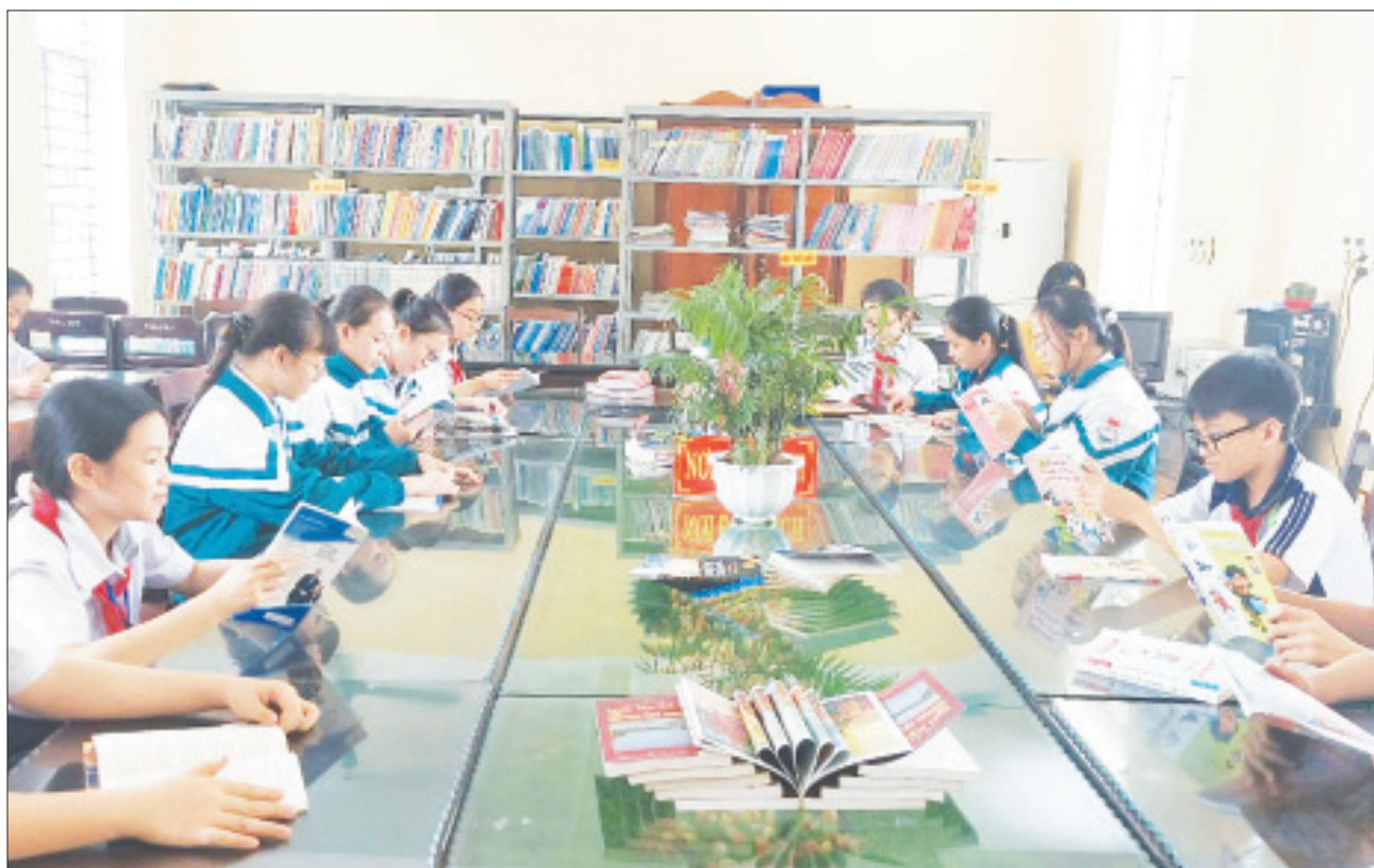
Hoạt động hưởng ứng Ngày Sách và Văn hóa đọc Việt Nam tỉnh Nam Định năm 2024 của học sinh Trường THCS Trần Huy Liệu (Vụ Bản).

Để xây dựng môi trường văn hóa học đường hiệu quả và bền vững, Sở GD và ĐT đã chú trọng tích hợp, lồng ghép nội dung thực hiện Chỉ thị số 05-CT/TW về “Đẩy mạnh học tập và làm theo tư tưởng, đạo đức, phong cách Hồ Chí Minh”; tổ chức hiệu quả các hoạt động giáo dục đạo đức, lối sống cho học sinh trong các nhà trường thông qua lồng ghép nội dung các môn học, hoạt động ngoại khóa; đẩy mạnh thực hiện công tác tư vấn tâm lý; tổ chức các cuộc thi, hội thi hoặc tạo điều kiện cho học sinh tham gia các cuộc thi, hội thi nhằm tăng cường giáo dục thẩm mỹ, giáo dục tư tưởng chính trị, đạo đức, lối sống, văn hóa ứng xử trong môi trường giáo dục cho học sinh; chỉ đạo các cơ sở giáo dục (CSGD) sử dụng hiệu quả bộ tài liệu “Bác Hồ và những bài học về đạo đức lối sống” dành cho học sinh phổ thông... Tiêu biểu như cuộc thi “Bác Hồ với thiếu nhi - Thiếu nhi với Bác Hồ”; cuộc thi trực tuyến “Tuổi trẻ học tập và làm theo tư tưởng, đạo đức, phong cách Hồ Chí Minh”, cuộc thi “Vẽ tranh của thiếu niên, nhi đồng về Chiến thắng Điện Biên Phủ và hình ảnh Điện Biên Phủ hôm nay” năm học