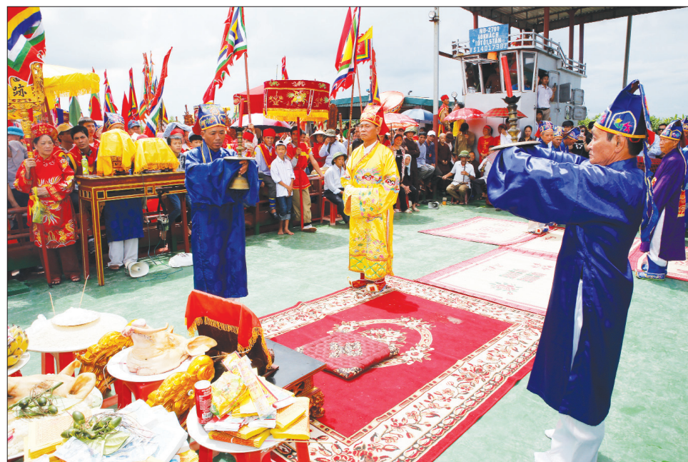
Nghi thức tế "Tam Kỳ giang" trong lễ hội Đền Độc Bộ, xã Yên Nhân (Ý Yên).

Tín ngưỡng thờ các vị thần sông nước (thủy thần) từ lâu đã là một phần không thể thiếu trong văn hóa dân gian của người Việt. Tại Nam Định, các vị thủy thần như Nam Hải Đại Vương, Đông Hải Đại Vương, Linh Lang Đại Vương... được thờ phụng tại nhiều di tích lịch sử - văn hóa. Ngoài giá trị tâm linh, những di tích còn là kho tàng kiến trúc và nghệ thuật, gắn liền với các lễ hội truyền thống đặc sắc, phản ánh bản sắc văn hóa phong phú của các địa phương.