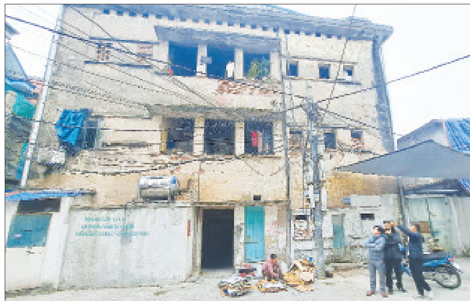
Khu chung cư 3 tầng cũ đã xuống cấp nặng.