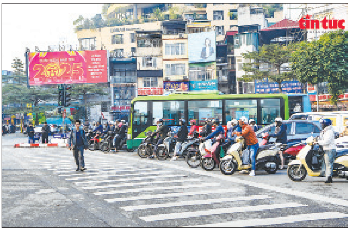
Sau khi triển khai Luật Trật tự, an toàn giao thông đường bộ và Nghị định 168/CP, các hành vi vi phạm luật giao thông đã giảm mạnh, ý thức người dân được nâng cao.

bóp méo sự thật của các đối tượng phản động, chống đối, các tổ chức truyền thông thiếu thiện chí với Việt Nam đã tạo ra những luồng thông tin, dư luận xấu, ảnh hưởng đến việc thực thi Nghị định 168. Rõ ràng, mục tiêu chính của Nghị định 168/2024/NĐ-CP là bảo đảm an toàn giao thông và giảm thiểu những vụ tai nạn thương tâm, nâng cao ý thức chấp hành pháp luật về giao thông, tránh tình trạng coi thường pháp luật, “nhờn luật” vì xử phạt nhẹ không đủ sức răn đe.