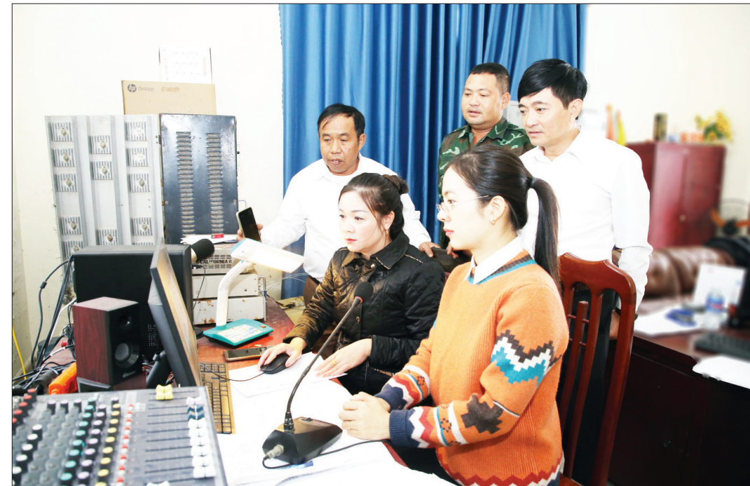
Cán bộ xã Nghĩa Phong (Nghĩa Hưng) duyệt chương trình phát thanh trên hệ thống truyền thanh thông minh.