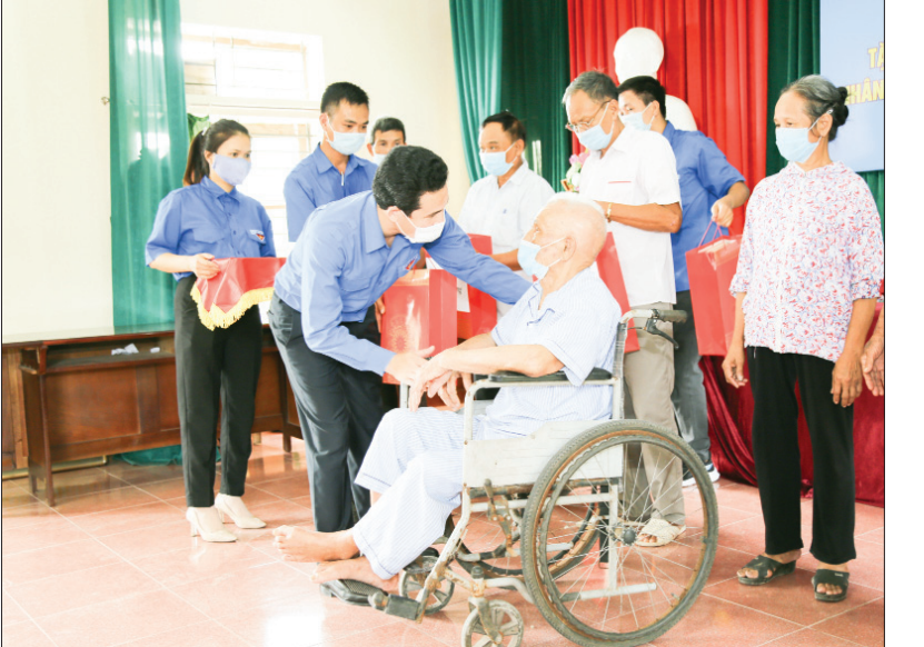
Lãnh đạo Tỉnh Đoàn trao tặng quà cho các gia đình chính sách trên địa bàn thành phố Nam Định.

Ngoài ra, Ban Thường vụ Tỉnh Đoàn ứng dụng và phát huy vai trò mạng xã hội vào công tác giáo dục của Đoàn. Bên cạnh giải pháp truyền thống như tổ chức hội nghị, hội họp, diễn đàn, tình nguyện, truyền thanh... Các cấp bộ Đoàn đang duy trì 255 facebook, fanpage, chia sẻ và đăng tải hơn 2.500 tin, bài truyền truyền định hướng cho tuổi trẻ với trên 80.300 người theo dõi. Đây là những trang chính thống của tổ chức Đoàn, nơi chia sẻ các hình ảnh, bài viết, câu chuyện đẹp "gương người tốt, việc tốt" và thường xuyên duy trì chuyên mục "Mỗi ngày một tin tốt -