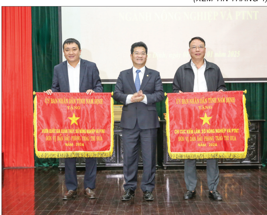
Đồng chí Trần Anh Dũng, Ủy viên Ban TTVU, Phó Chủ tịch Thường trực UBND tỉnh trao cờ đơn vị dẫn đầu phong trào thi đua năm 2024 của UBND tỉnh cho các tập thể có thành tích xuất sắc của ngành Nông nghiệp.