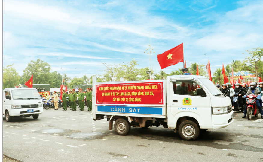
Lực lượng chức năng huyện Hải Hậu ra quân thực hiện cao điểm trấn áp tội phạm đảm bảo an ninh trật tự Tết Nguyên đán Ất Tỵ 2025.

Trong thực hiện các biện pháp nghiệp vụ, Công an huyện Hải Hậu đã chủ động phối hợp với Viện Kiểm sát nhân dân, Tòa án nhân dân huyện xây dựng quy chế phối hợp liên ngành trong việc tiếp nhận, giải quyết tố giác, tin báo về tội phạm và kiến nghị khởi tố để xác định rõ chức năng, nhiệm vụ, trách nhiệm thông tin, báo cáo; cách thức phối hợp giữa các cơ quan, nhằm đảm bảo sự phối hợp chặt chẽ, thường xuyên, hiệu quả. Công an huyện đã chủ động, tích cực triển khai trong các đội nghiệp vụ trong cơ quan, đồng thời chỉ đạo Công an các xã, thị trấn sắp xếp, phân công cán bộ phù hợp với tình hình biên chế của đơn vị; bố trí hòm thư, địa điểm tiếp nhận thuận tiện, có biển báo, để nhận biết; thực hiện nghiêm chế độ trực nghiệp vụ theo quy định, đảm bảo tiếp nhận đầy đủ các tố giác, tin báo về tội phạm và kiến nghị khởi tố theo quy định của pháp luật. Đã thực hiện việc mở sổ ghi chép, theo dõi việc tiếp nhận, giải quyết tin báo, tố giác tội phạm được cập nhật đầy đủ rõ ràng. Công tác kiểm tra, hướng dẫn việc thực hiện các quy định về tiếp nhận, giải quyết tố giác, tin báo về tội phạm, kiến nghị khởi tố được quan tâm đối với các xã, thị trấn thường xuyên.