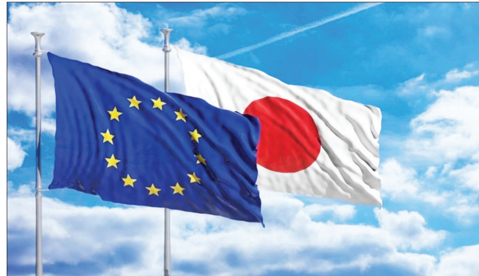
Ảnh minh họa.

Tuy nhiên, trong bối cảnh tình hình thế giới diễn biến phức tạp hiện nay, với lợi ích và xung đột đan xen, mối quan hệ đối tác chiến lược giữa EU và Nhật Bản cũng đối mặt không ít