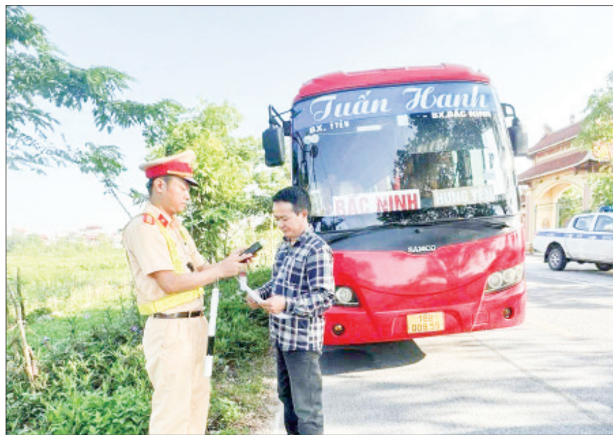
Công an huyện Ý Yên tăng cường kiểm tra việc chấp hành các quy định của pháp luật về vận tải hành khách bằng ô tô.