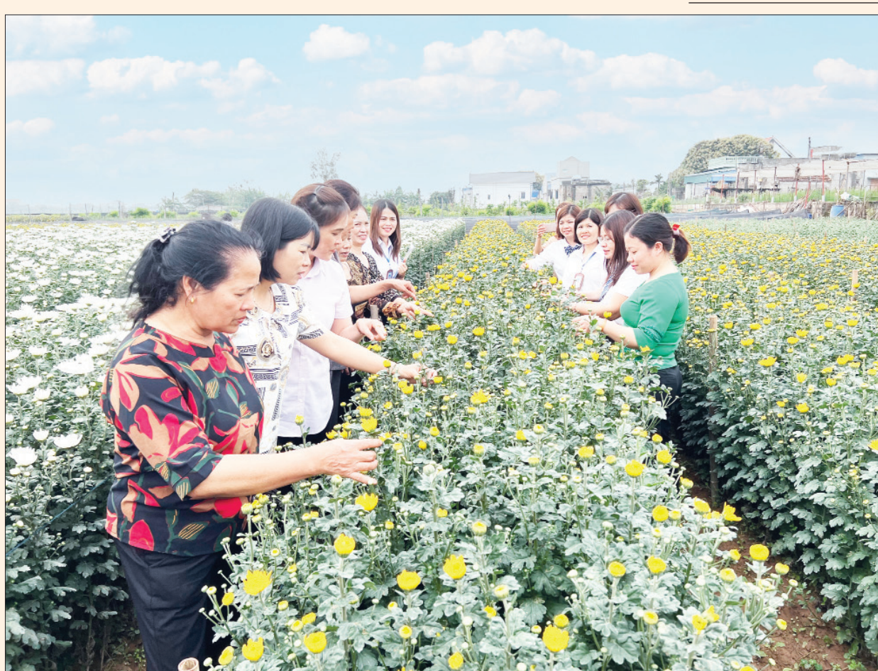
TYM Ý Yên thường xuyên tổ chức các chương trình tham quan, học tập mô hình kinh tế tiêu biểu thu hút đồng thành viên, hội viên phụ nữ tham gia.