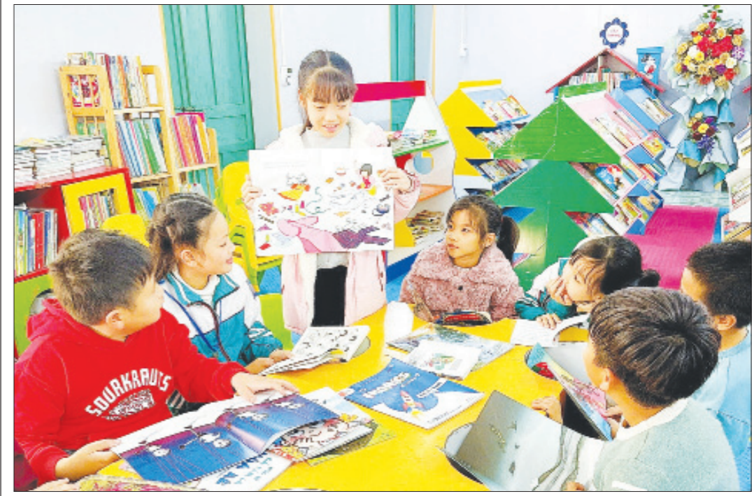
Trường Tiểu học thị trấn Cồn (Hải Hậu) đã thực hiện nhiều biện pháp phòng, chống rét để đảm bảo sức khỏe học tập cho học sinh.

Theo dự báo từ Trung tâm Dự báo khí tượng thủy văn quốc gia, mùa đông năm nay có những diễn biến phức tạp với các đợt rét đậm, rét hại tác động mạnh khiến nhiệt độ giảm sâu, trời rét buốt kèm theo mưa phùn. Điều này gây ảnh hưởng không nhỏ đến sức khỏe học sinh, đặc biệt là lứa tuổi mầm non, tiểu học sức đề kháng còn yếu, bởi khi thời tiết chuyển lạnh đột ngột, các em sẽ bị nhiễm lạnh và gây ra nhiều bệnh nguy hiểm cho bản thân như: ho, sốt, viêm họng, viêm phế quản... Để đảm bảo sức khỏe, an toàn cho học sinh đến lớp, các trường học trên địa bàn tỉnh đã triển khai nhiều biện pháp ứng phó, sửa chữa kịp thời các phòng học, phòng học năng, trang thiết bị, đảm bảo tránh gió lùa, đủ ánh sáng và giữ ấm cho học sinh.