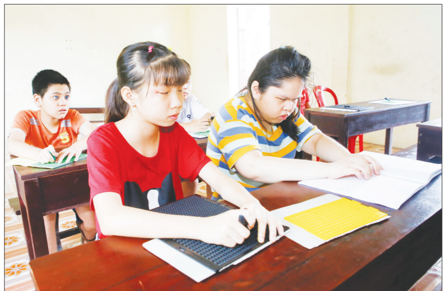
Một buổi học chữ nổi của học viên Trung tâm Hỗ trợ phát triển giáo dục hòa nhập Hội Người mù tỉnh.

Nhờ sự quan tâm của các cấp ủy đảng, chính quyền và các cấp Hội Người mù, cùng sự đồng hành từ toàn xã hội, chữ nổi Braille không chỉ đang dần phổ cập với từng người khiếm thị mà còn trở thành cầu nối quan trọng, góp phần nâng cao chất lượng đời sống, tạo cơ hội phát triển và khẳng định quyền bình đẳng trong việc tiếp cận tri thức của mỗi người.