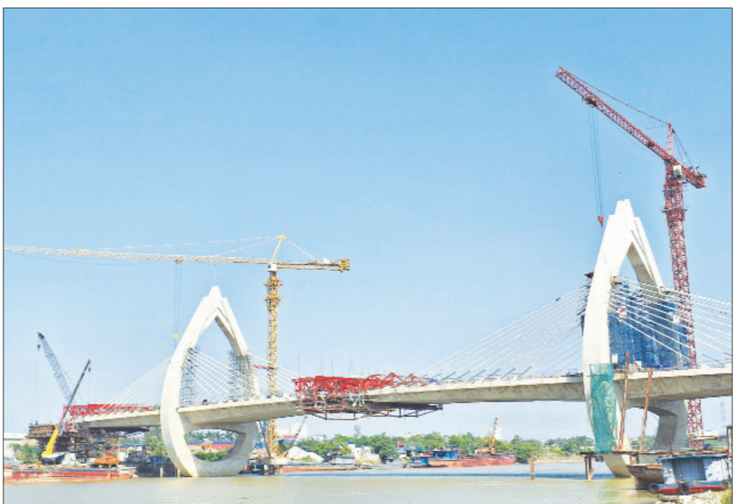
Công trình cầu vượt sông Đào nối từ đường Song Hào đến đường Vũ Hữu Lợi (thành phố Nam Định) đang được khẩn trương hoàn thành để đưa vào khai thác phục vụ phát triển kinh tế - xã hội.

Những thành tựu nổi bật của năm 2024 là nền tảng tạo nên sự vững tin để các cấp, ngành, các địa phương của tỉnh tiếp tục quyết tâm nỗ lực đổi mới, sáng tạo, quyết liệt hành động, phát triển kinh tế - xã hội trong năm mới 2025 hoàn thành tốt các mục tiêu, nhiệm vụ Nghị quyết Đại hội Đảng bộ tỉnh lần thứ XX, kế hoạch phát triển kinh tế - xã hội 5 năm 2021-2025 của UBND tỉnh đã đề ra ■