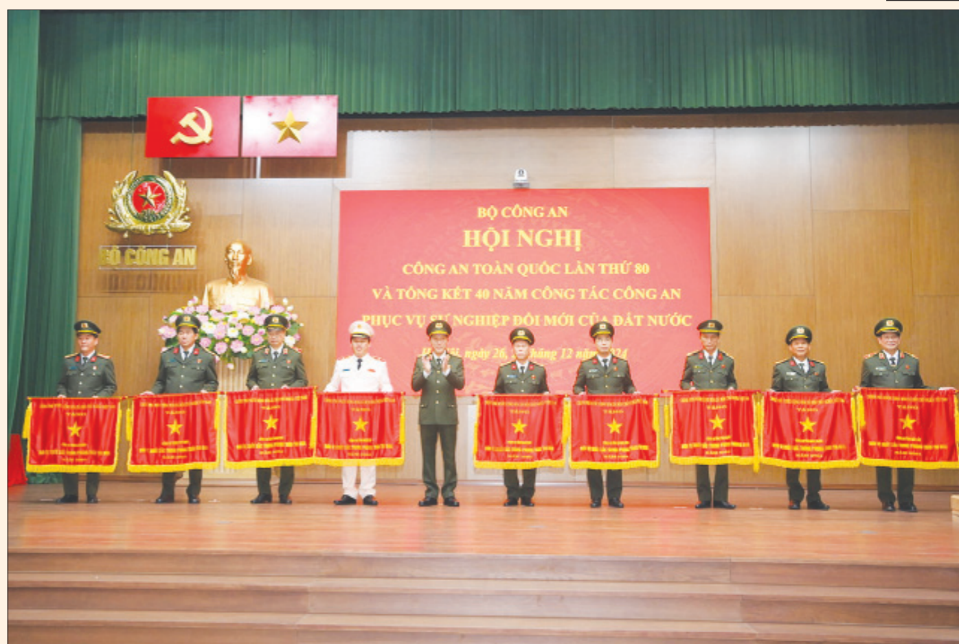
Thủ tướng Chính phủ, Đại tướng Lương Tam Quang, Ủy viên Bộ Chính trị, Bộ trưởng Bộ Công an trao cờ thi đua xuất sắc năm 2024 cho Công an tỉnh Nam Định.