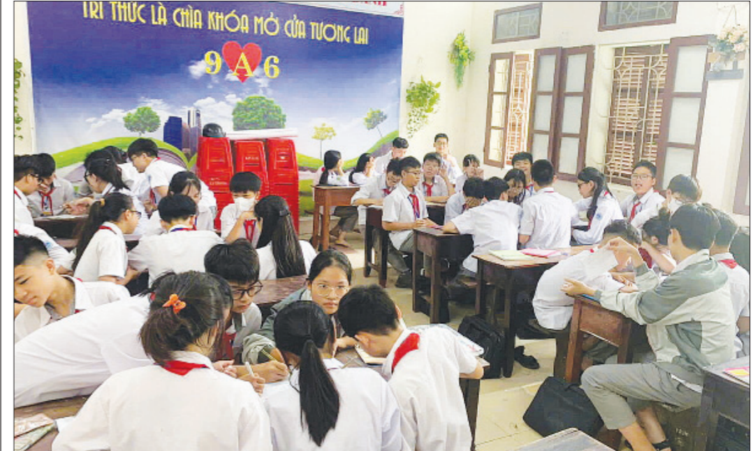
Một buổi tư vấn hướng nghiệp cho học sinh Trường THCS Hàn Thuyên (thành phố Nam Định).