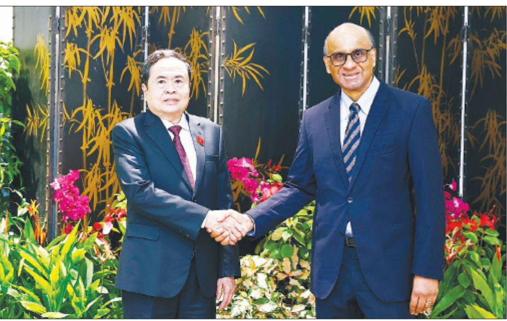
Chủ tịch Quốc hội Trần Thanh Mẫn hội kiến Tổng thống Singapore Tharman Shanmugaratnam sáng 3/12.

Chiều 3/12 theo giờ địa phương, Chủ tịch Quốc hội Trần Thanh Mẫn và Phu nhân cùng Đoàn đại biểu cấp cao Quốc hội Việt Nam đã kết thúc tốt đẹp chuyến thăm chính thức Cộng hòa Singapore, rời sân bay Changi Singapore, lên đường thăm chính thức Nhật Bản từ ngày 3 đến 7/12/2024. Trong khuôn khổ chuyến thăm, Chủ tịch Quốc hội Trần Thanh Mẫn đã hội kiến Tổng thống Singapore Tharman Shanmugaratnam, Thủ tướng Singapore Lawrence Wong, hội đàm với Chủ tịch Quốc hội Singapore Seah Kian Peng. Tại các cuộc hội đàm, hội kiến, lãnh đạo hai nước khẳng định quan hệ Việt Nam - Singapore không ngừng phát triển, đạt nhiều dấu mốc quan trọng trên tất cả các lĩnh vực; nhất trí thời gian tới, hai bên sẽ tiếp tục phối hợp chặt chẽ, sớm đưa quan