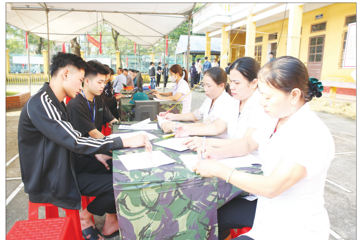
Thanh niên huyện Ý Yên đến Trung tâm Ý Yên huyện đăng ký khám sức khỏe sẵn sàng nhập ngũ năm 2025.

Với việc tập trung triển khai đồng bộ các biện pháp nâng cao chất lượng công tác tuyển chọn, gọi công dân nhập ngũ, huyện Ý Yên quyết tâm hoàn thành 100% chỉ tiêu giao quân năm 2025