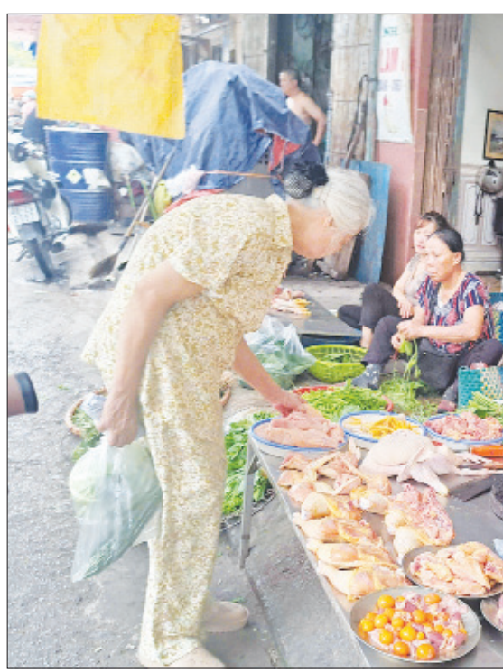
Khu vực bán thực phẩm tươi sống tại chợ Hoàng Ngân (thành phố Nam Định).

lượng hàng bán ra tương đối nhiều và đông người qua lại. Nhưng nếu không làm thì hầu như cá hay gà, vịt không ai mua vì khách hàng bây giờ đều ngại giết mổ tại nhà. Chính tâm lý, nhu cầu của khách đã vô tình gây ra nhiệm vụ cho thực phẩm của mình cũng như ô nhiễm môi trường khu vực chợ, tiềm ẩn nguy cơ lây lan dịch bệnh". Bên cạnh thực phẩm tươi sống, nhiều người dân có thói quen mua thức ăn đã chế biến sẵn tại các chợ bởi sự tiện lợi, giá cả hợp lý và nhanh chóng, như thịt quay, nem, cháo, dưa, củ muối... Các mặt hàng này thường được chế biến và bày bán ở khu vực không bảo đảm ATVSTP như vỉa hè, mặt đường, thu hút khá đông thực khách. Các loại thực phẩm khô cũng rất đáng lo ngại về tình trạng vi phạm ATVSTP. Nhiều mặt hàng như bánh kẹo, nắm, mềng khô, gia vị... chỉ được đóng trong các bao tải, không nhãn mác. Qua tìm hiểu được biết, phần lớn những thực phẩm này được nhập từ nước ngoài dưới dạng đóng thùng carton