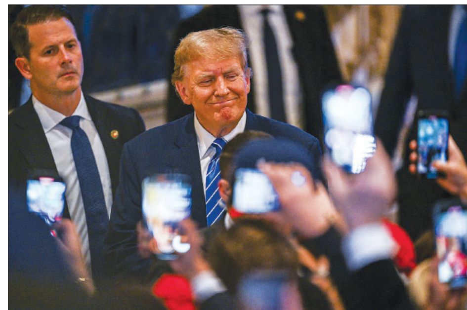
Tổng thống đắc cử Mỹ Donald Trump.

Các đối tác của Washington ở châu Á dường như nhận thấy rằng việc ông Trump trở lại Nhà Trắng có thể khiến Mỹ giảm bớt sự can dự vào khu vực này. Chính quyền Mỹ mới dự kiến