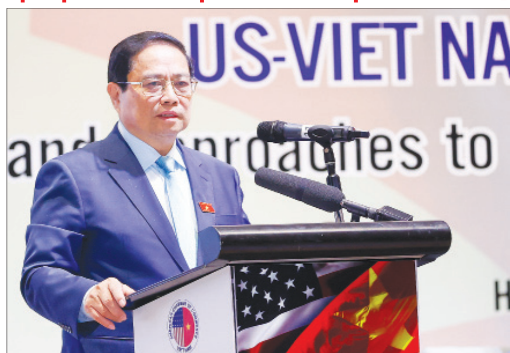
Thủ tướng Phạm Minh Chính nhấn mạnh thương mại là lĩnh vực hợp tác kinh tế lớn nhất, thành công nhất trong quan hệ Việt Nam - Hoa Kỳ.

Sáng 27/11, tại Hà Nội, Thủ tướng Chính phủ Phạm Minh Chính dự Hội nghị Thượng đỉnh Kinh doanh Việt Nam - Hoa Kỳ năm 2024 do Liên đoàn Thương mại và Công nghiệp Việt Nam (VCCI) phối hợp Hiệp hội Thương mại Hoa Kỳ tại Việt Nam (AmCham) và Phòng Thương mại Hoa Kỳ tại Washington tổ chức. Cùng dự có lãnh đạo các bộ, ngành Việt Nam; Đại sứ Hoa Kỳ và Đại sứ các nước tại Việt Nam; đồng đảo lãnh đạo doanh nghiệp hai nước. Ngoại trưởng Hoa Kỳ Antony Blinken và cựu Đại diện Thương mại Hoa Kỳ Michael Froman tham dự trực tuyến. Việt Nam - Hoa Kỳ đã nâng cấp quan hệ lên Đối tác Chiến lược toàn diện vào