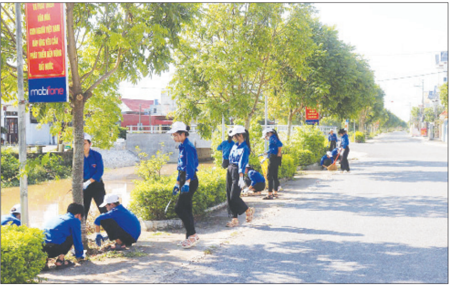
Đoàn viên, thanh niên huyện Giao Thủy ra quân vệ sinh môi trường.

Bên cạnh đó, Ban Thường vụ Tỉnh Đoàn chỉ đạo tổ chức các hoạt động tình nguyện tại chỗ và lấy địa bàn nông thôn làm trọng tâm. Các hoạt động được quan tâm triển khai như: Xây dựng nhà tình nghĩa, thăm tặng quà cho các gia đình chính sách, gia đình có công với cách mạng, trao tặng học bổng cho học sinh có hoàn cảnh khó khăn vươn lên học tốt, hỗ trợ xây, sửa nhà vệ sinh cho em; vệ sinh môi trường, cải tạo cảnh quan nông thôn phục vụ mục tiêu xây dựng nông thôn mới nâng cao, kiểu mẫu của tỉnh... Đến nay, toàn tỉnh đã thành lập và duy trì 60 đội hình tình nguyện với 840 đoàn viên, thanh niên tham gia; tổ chức 605 buổi ra quân vệ sinh môi trường, làm đẹp cảnh quan, chăm sóc nghĩa trang liệt sĩ gắn với các hoạt động "đền ơn, đáp nghĩa", "uống nước nhớ nguồn" với trên 10 nghìn lượt đoàn viên, thanh niên tham gia hưởng ứng; trồng mới 106.612 cây xanh; hỗ trợ xây mới và sửa chữa 10 ngôi nhà tình nghĩa, hỗ trợ sửa chữa 31km và làm mới 8km đường giao thông nông thôn.