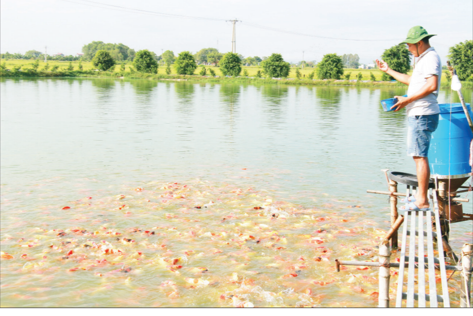
Mỗi năm Hợp tác xã sản xuất và thương mại Tân Khánh, xã Minh Tân xuất bán ra thị trường trên 100 tấn cá chép Koi.