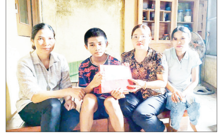
TYM huyện Vụ Bản tặng quà cho con thành viên có hoàn cảnh khó khăn vượt khó học giỏi.