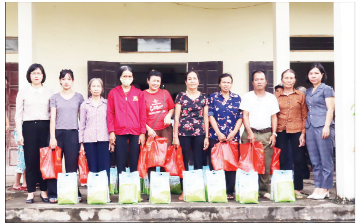
Hội Nông dân tỉnh, Hội Nông dân huyện Ý Yên và Công ty TNHH Toàn Xuân tặng quà cho hội viên nông dân xã Hồng Quang (Ý Yên) có hoàn cảnh khó khăn bị ảnh hưởng thiệt hại do cơn bão số 3 gây ra.