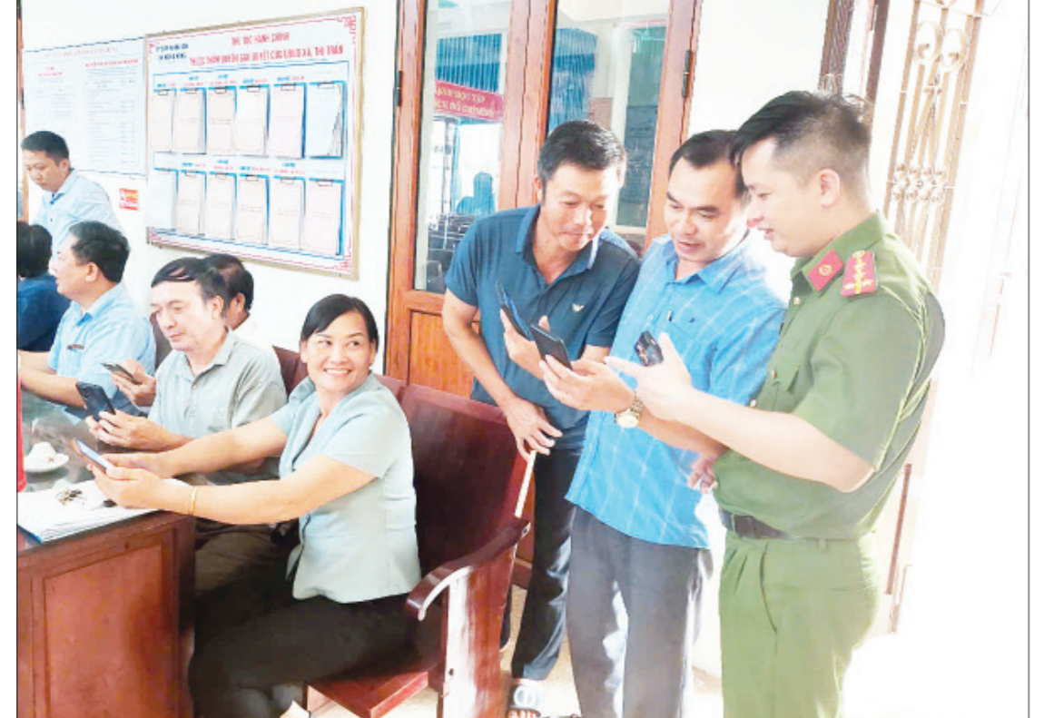
Tổ công tác dịch vụ công trực tuyến xã Nghĩa Hưng (Nghĩa Hưng) hướng dẫn người dân thực hiện dịch vụ công trực tuyến toàn trình.