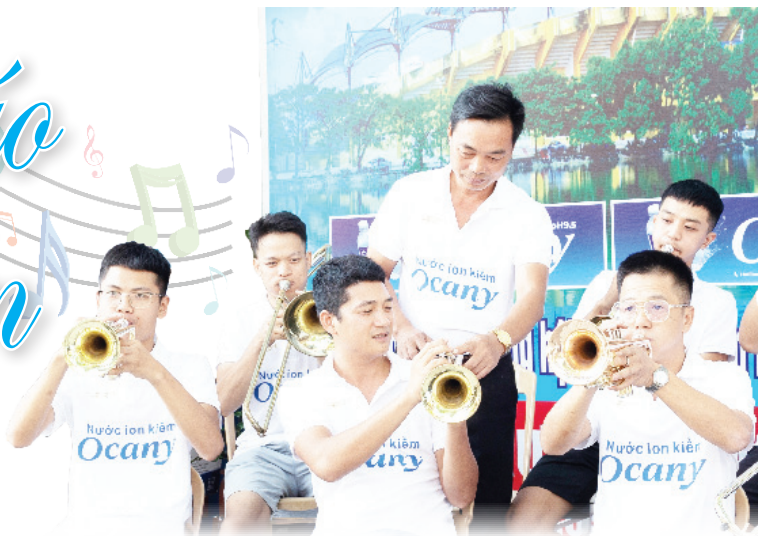
Nhạc trưởng đội kèn Thành Nam đang hướng dẫn các thành viên tập bản nhạc mới.