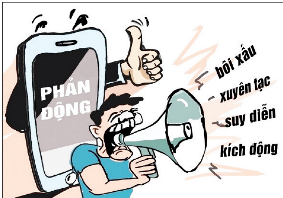
Những luận điệu xuyên tạc, vu cáo.

Không kêu gọi được đồng người tham gia biểu tình, các đối tượng tiếp tục sử dụng mạng xã hội viết các bài tố cáo độ hậm hực, dùng lời lẽ miệt thị, chế diễu hoạt động của lãnh đạo Đảng, Nhà nước ta, bôi nhọ quan hệ đối ngoại Việt Nam với Hoa Kỳ. Để tăng thêm độ tin