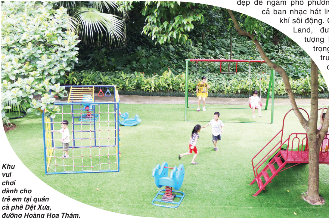
Khu vui chơi dành cho trẻ em tại quán cà phê Dệt Xưa, đường Hoàng Hoa Thám.

Những quán cà phê giờ đây đã trở thành một phần rất đời quen thuộc, thân thương của phố. Khi vui, và cả lúc buồn, chỉ cần gặp bạn bè, người thân nơi quán quen, lặng nghe từng giọt cà phê đặc sắc, thơm nồng tí tách rơi, đắm mình trong hương cà phê mê hoặc và quyến rũ, sẽ thấy tâm hồn thật nhẹ nhàng, thư thái ■