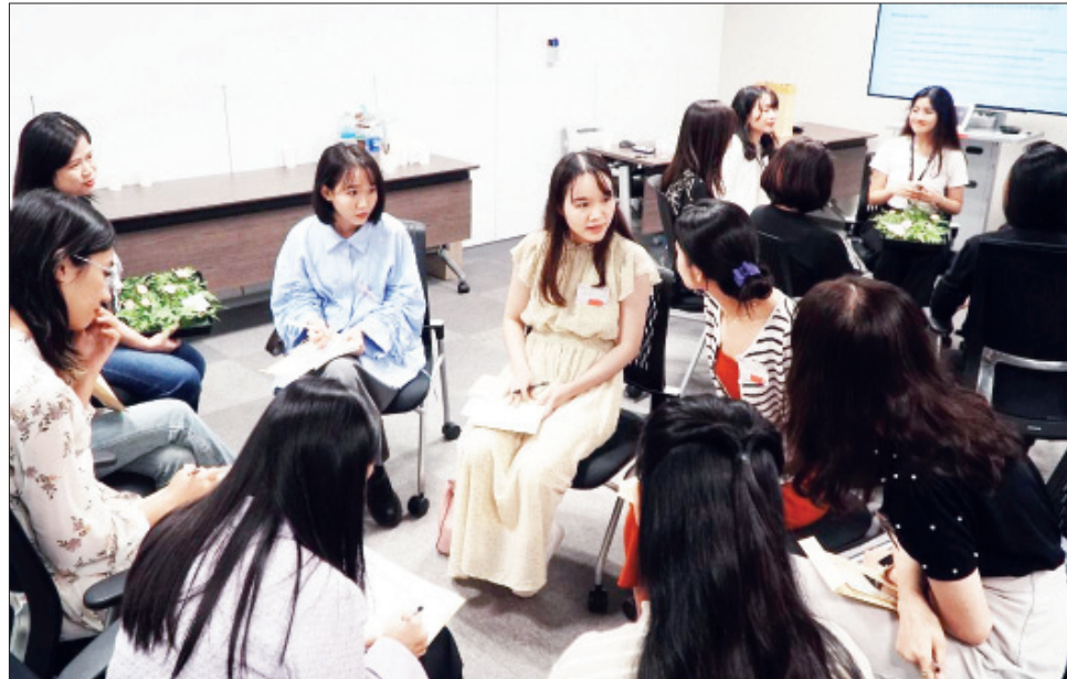
Những bạn nữ tham gia sự kiện thảo luận sôi nổi về các chủ đề và chia sẻ kinh nghiệm của bản thân.

Tại Thủ đô Tokyo vừa diễn ra sự kiện giao lưu phụ nữ với chủ đề "Phụ nữ: Giậm chân hay bứt phá?". Đây là hoạt động thiết thực hướng tới kỷ niệm Ngày Phụ nữ Việt Nam 20/10, thu hút đông đảo chị em phụ nữ Việt Nam đang sinh sống, lao động, học tập tại Nhật Bản cùng trao đổi, chia sẻ kiến thức, kinh nghiệm, bí quyết thành công cũng như cân bằng giữa gia đình và công việc.