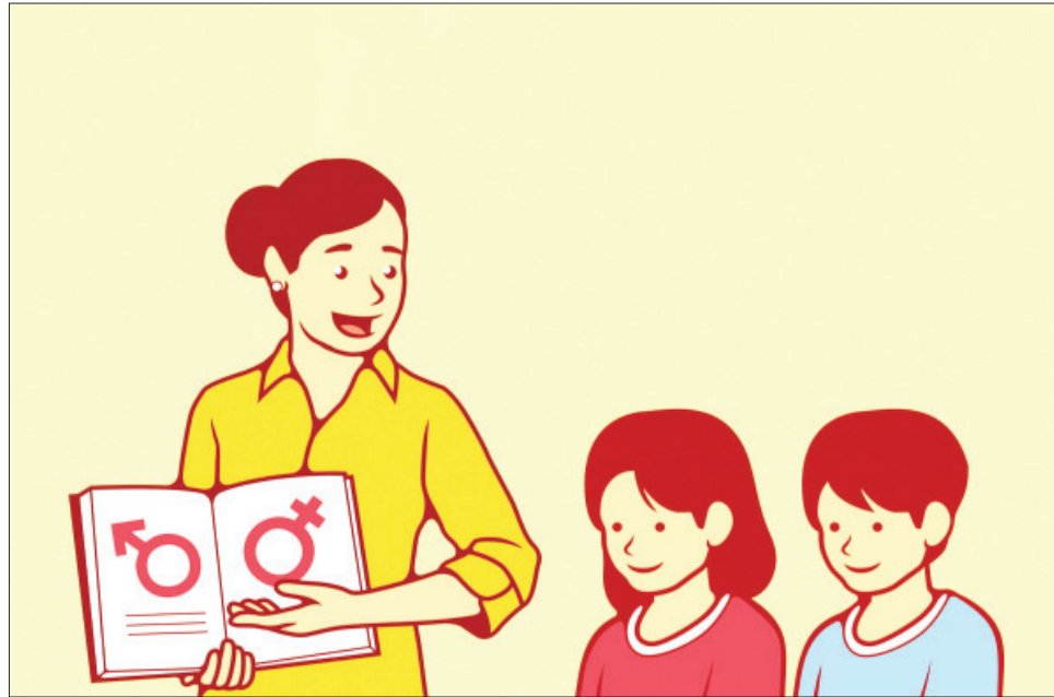
Giáo dục giới tính ngay từ nhỏ để trẻ bảo vệ bản thân đúng cách. (Tranh minh họa)

nhận thấy các em rất quan tâm tới vấn đề tâm sinh lý bản thân. Vì vậy, việc tổ chức những chuyên đề giáo dục giới tính và CSSKSS với sự dẫn dắt, chia sẻ từ các chuyên gia cho các em là rất cần thiết nhằm giúp các em tiếp cận được với các vấn đề giáo dục giới tính một cách dễ dàng hơn". Bên cạnh việc thường xuyên tổ chức các buổi ngoại khóa, nhà trường khuyến khích học sinh tiếp cận với giáo dục giới tính từ nhiều khía cạnh, phương diện thông qua các hoạt động tập thể như: lồng ghép giáo dục giới tính cho học sinh thông qua các môn học như Giáo dục công dân, Sinh học, Ngữ văn; mời các diễn giả về nói chuyện, chia sẻ với học sinh các kiến thức về tình bạn, tình yêu lứa tuổi học trò... từ đó giúp các em học sinh tiếp cận được với các vấn đề giáo dục giới tính một cách dễ dàng hơn. Ban giám hiệu nhà trường yêu cầu trong giờ sinh hoạt hàng tuần, giáo viên chủ nhiệm đưa nội dung giáo dục giới tính lồng ghép vào các hoạt động xây dựng nền nếp, tác phong học tập cho học sinh và đã mang lại hiệu quả tích cực.