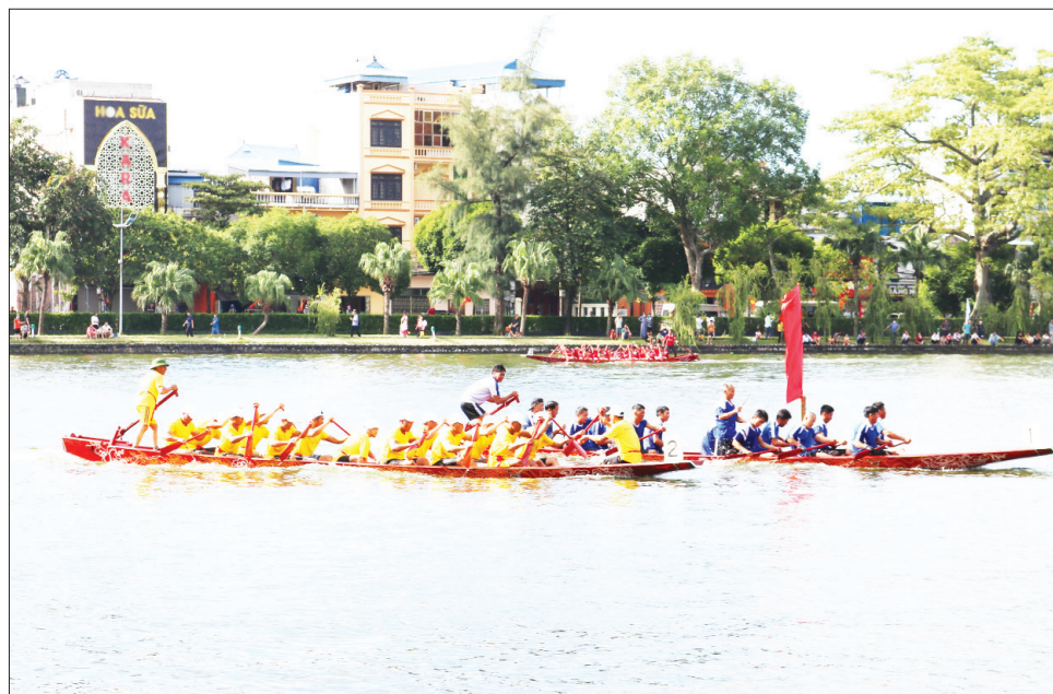
Giải bơi chài tỉnh trên hồ Vị Xuyên (thành phố Nam Định).

Nhìn lại quá trình phát triển thể thao Nam Định, ở thế kỷ trước, bóng đá Nam Định đã 2 lần tạo tiếng vang trong khu vực. Đội bóng Nam Định mang tên Cotonkin từng vô địch Đông Dương vào các năm 1943, 1945. Đến những năm kháng chiến chống Mỹ cứu nước, thể