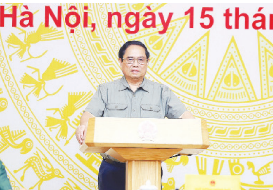
Thủ tướng Chính phủ Phạm Minh Chính chủ trì Hội nghị.

Sáng 15/9, đồng chí Phạm Minh Chính, Ủy viên Bộ Chính trị, Thủ tướng Chính phủ chủ trì Hội nghị đánh giá tình hình thiệt hại do cơn bão số 3 gây ra và triển khai giải pháp khắc phục hậu quả, hỗ trợ người dân, doanh nghiệp ổn định đời sống, thúc đẩy hoạt động sản xuất, kinh doanh sau bão. Dự hội nghị có đồng chí Nguyễn Hòa Bình, Ủy viên Bộ Chính trị, Phó Thủ tướng Thường trực Chính phủ; các đồng chí Ủy viên BCH Trung ương Đảng, Phó Thủ tướng Chính phủ: Trần Hồng Hà, Lê Thành Long; lãnh đạo các bộ, ngành Trung ương và lãnh đạo 26 tỉnh, thành phố bị ảnh hưởng bởi bão số 3.