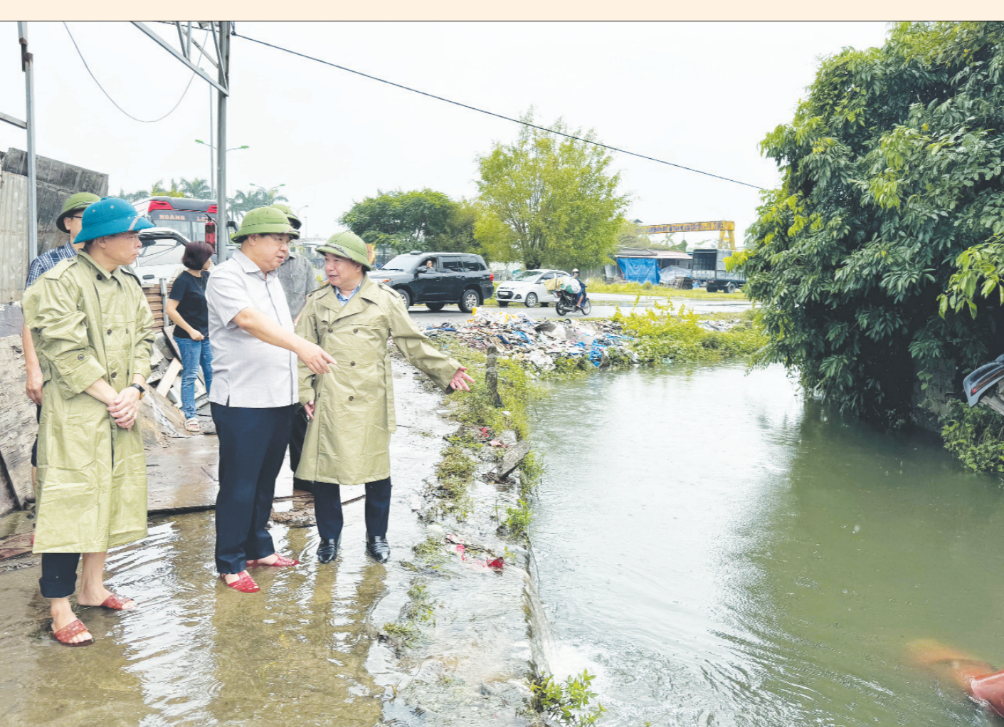
Đồng chí Phạm Gia Túc, Ủy viên BCH Trung ương Đảng, Bí thư Tỉnh ủy kiểm tra, chỉ đạo công tác khắc phục úng ngập trên địa bàn thành phố Nam Định.

Với sự chuẩn bị kỹ lưỡng, tinh thần chủ động và phối hợp chặt chẽ từ các cấp ủy Đảng, chính quyền, tỉnh đã triển khai ứng phó kịp thời với các tình huống bão lụt do siêu bão số 3 (Yagi) gây ra; bảo vệ tuyệt đối an toàn tính mạng cho người dân và giảm tối đa thiệt hại về tài sản, công trình hạ tầng; sau khi bão đi qua, đã nhanh chóng ổn định tình hình, đưa cuộc sống người dân sớm trở lại bình thường.