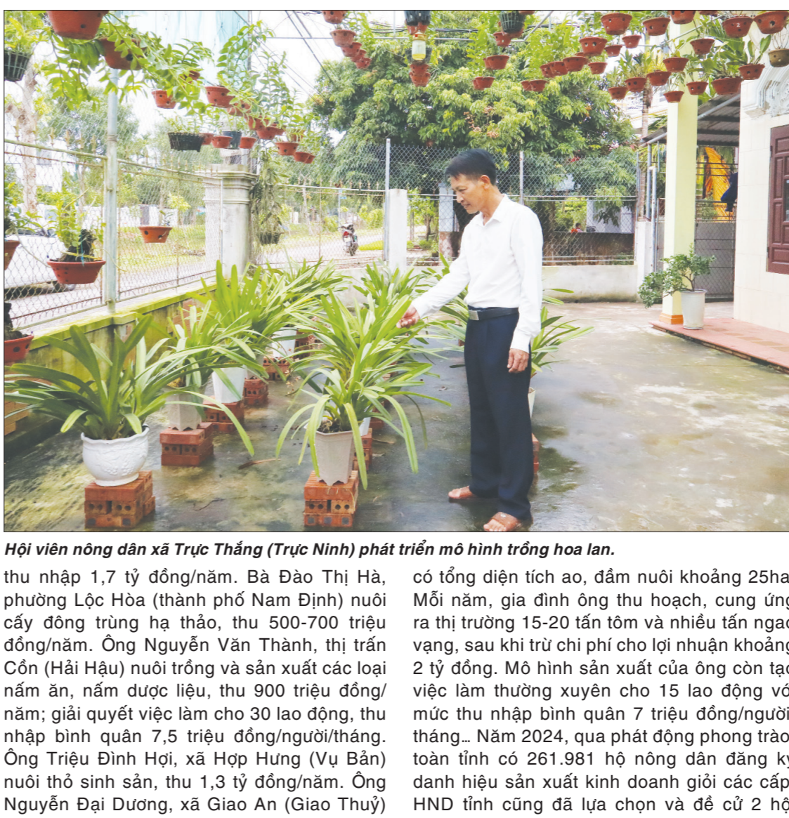
Hội viên nông dân xã Trực Thăng (Trực Ninh) phát triển mô hình trồng hoa lan.