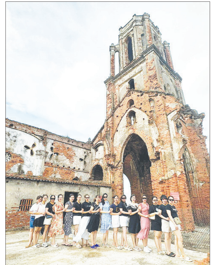
Du khách tham quan di tích "Nhà thờ đổ" xã Hải Lý.