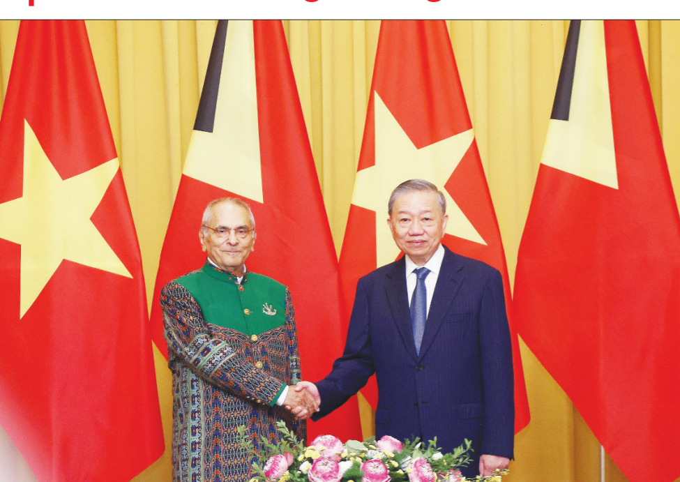
Chủ tịch nước Tô Lâm và Tổng thống Timor-Leste Jose Ramos-Horta.

Nhận lời mời của Chủ tịch nước Tô Lâm, Tổng thống Jose Ramos-Horta đã dẫn đầu Đoàn đại biểu cấp cao Timor Leste thăm cấp Nhà nước tới Việt Nam từ ngày 31/7 đến 03/8/2024.