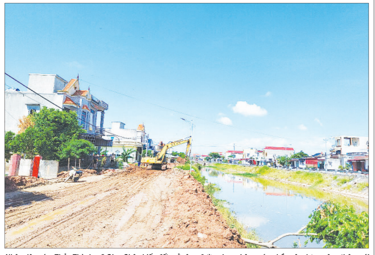
Nhân dân xóm Thủy Thành, xã Giao Châu hiến đất mở rộng đường Lạc - Lâm, góp phần xây dựng nông thôn mới nâng cao, kiểu mẫu.

người của huyện đạt trên 84 triệu đồng/năm, tỷ lệ hộ nghèo đa chiều năm 2023 giảm còn 0,76%; tỷ lệ người dân tham gia bảo hiểm y tế đạt trên 95,8%, tỷ lệ hộ dân dùng nước sạch đạt trên 94%. Toàn huyện đã có 20/22 xã, thị trấn được tỉnh công nhận NTM nâng cao, 14/20 xã NTM kiểu mẫu; 2 thị trấn đạt đô thị văn minh; 147/195 xóm đạt chuẩn NTM kiểu mẫu; xã Giao Phong là một trong 3 xã trên toàn quốc được Chính phủ và Bộ Nông nghiệp và Phát triển nông thôn chọn để thực hiện thí điểm "Mô hình xã NTM thông minh". Vừa qua, 100% thành viên Hội đồng thẩm định Trung ương đã bỏ phiếu đồng ý trình Thủ tướng Chính phủ xem xét công nhận huyện Giao Thủy đạt chuẩn NTM nâng cao năm 2023.