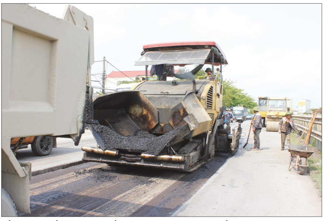
Cải tạo, nâng cấp mặt đường Quốc lộ 10 qua địa phận huyện Vụ Bản tạo thuận lợi cho người và phương tiện lưu thông.

6 tháng đầu năm 2024, tốc độ tăng trưởng ngành công nghiệp và xây dựng của huyện Vụ Bản đạt 15,63%. Cùng với việc quan tâm đầu tư các dự án hạ tầng kỹ thuật, huyện Vụ Bản cũng quan tâm giải quyết những vướng mắc, bất cập phát sinh, tồn tại trong các lĩnh vực hạ tầng giao thông, xây dựng để phục vụ mục tiêu phát triển toàn diện kinh tế - xã hội.