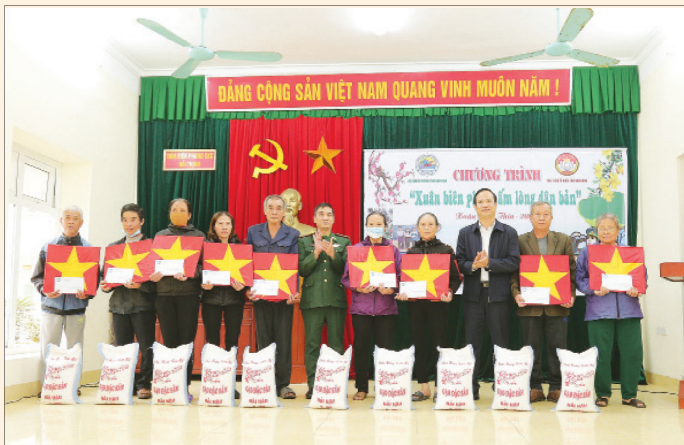
Mặt trận Tổ quốc tỉnh phối hợp với Bộ đội Biên phòng tỉnh tặng quà cho người dân huyện Hải Hậu tại chương trình "Xuân biên phòng ấm lòng dân bản".