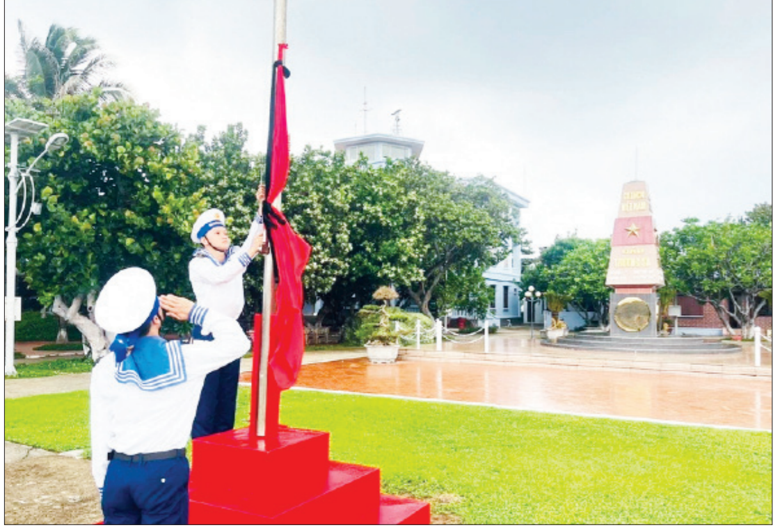
Cán bộ, chiến sĩ tại quần đảo Trường Sa thực hiện nghi thức treo cờ rủ để tưởng nhớ Tổng Bí thư Nguyễn Phú Trọng.

Tại Hội trường Nhà văn hóa thôn Lại Đà, xã Đông Hội, huyện Đông Anh, thành phố Hà Nội, vào viếng Tổng Bí thư Nguyễn Phú Trọng có Đoàn đại biểu Thành ủy, HĐND, UBND, Ủy ban MTTQ Việt Nam thành phố Hà Nội; các ban, ngành, đoàn thể tại địa phương... và đông đảo nhân dân đã đến viếng, bày tỏ lòng tiếc thương sâu sắc Tổng Bí thư Nguyễn Phú Trọng, người con ưu tú của quê hương Đông Hội. ■