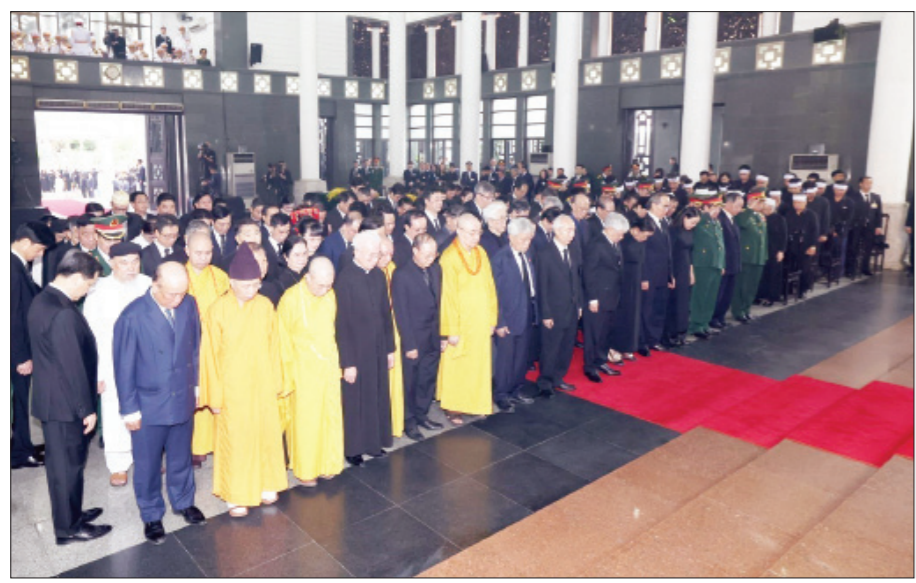
Đoàn Ủy ban Trung ương MTTQ Việt Nam do đồng chí Đỗ Văn Chiến, Ủy viên Bộ Chính trị, Bí thư Trung ương Đảng, Chủ tịch Ủy ban Trung ương MTTQ Việt Nam làm Trưởng đoàn, kính viếng Tổng Bí thư Nguyễn Phú Trọng.