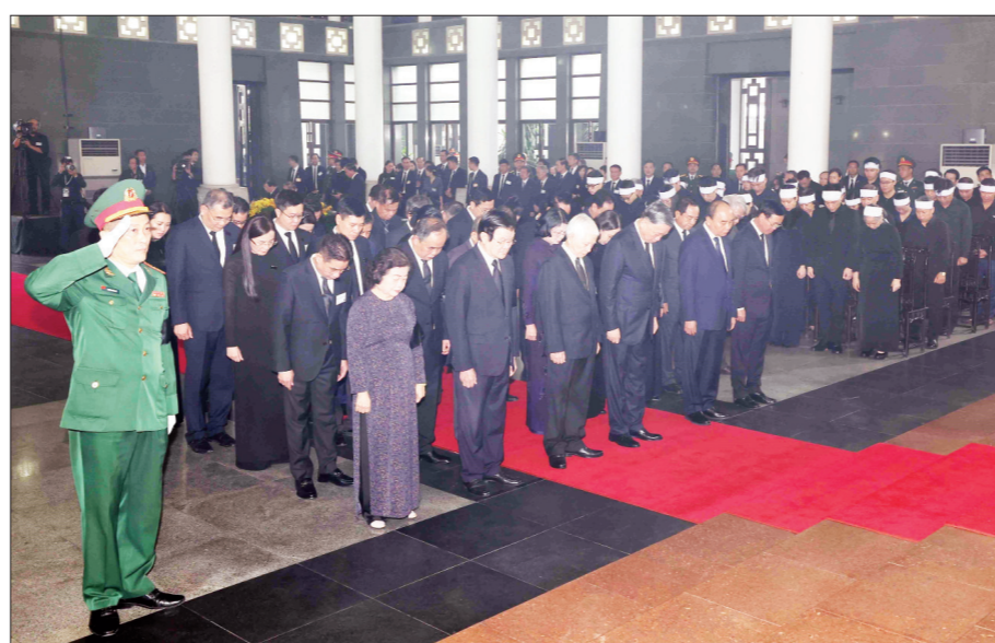
Đoàn Chủ tịch nước do đồng chí Tô Lâm, Ủy viên Bộ Chính trị, Chủ tịch nước làm Trưởng đoàn, kính viếng Tổng Bí thư Nguyễn Phú Trọng.