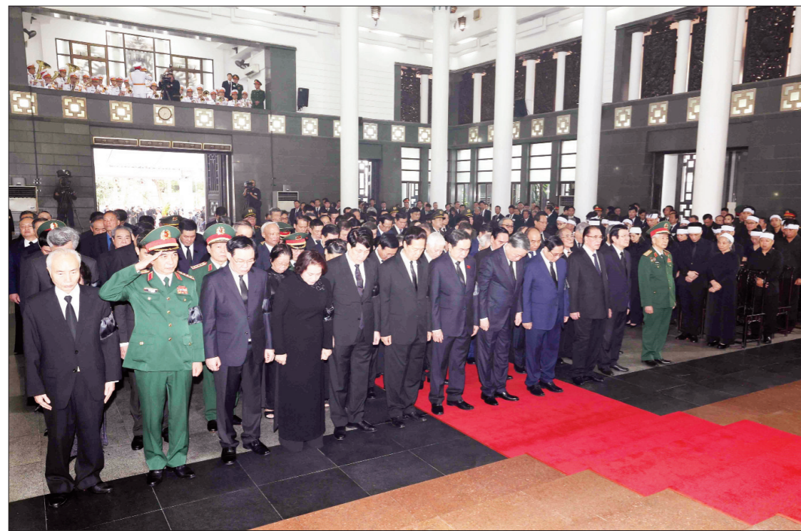
Đoàn Ban Chấp hành Trung ương Đảng Cộng sản Việt Nam do đồng chí Tô Lâm, Ủy viên Bộ Chính trị, Chủ tịch nước làm Trưởng đoàn, kính viếng Tổng Bí thư Nguyễn Phú Trọng.

Sáng 25/7, tại Nhà Tang lễ Quốc gia - số 5 Trần Thánh Tông (Hà Nội), cùng thời gian này tại Hội trường Thống Nhất (Thành phố Hồ Chí Minh) và quê nhà xã Đông Hội, huyện Đông Anh (thành phố Hà Nội), Ban Chấp hành Trung ương Đảng, Quốc hội, Chủ tịch nước, Chính phủ, Ủy ban Trung ương Mặt trận Tổ quốc (MTTQ) Việt Nam và gia đình đã tổ chức trọng thể Lễ viếng đồng chí Nguyễn Phú Trọng, Tổng Bí thư Ban Chấp hành Trung ương Đảng Cộng sản Việt Nam, theo nghi thức Quốc tang.