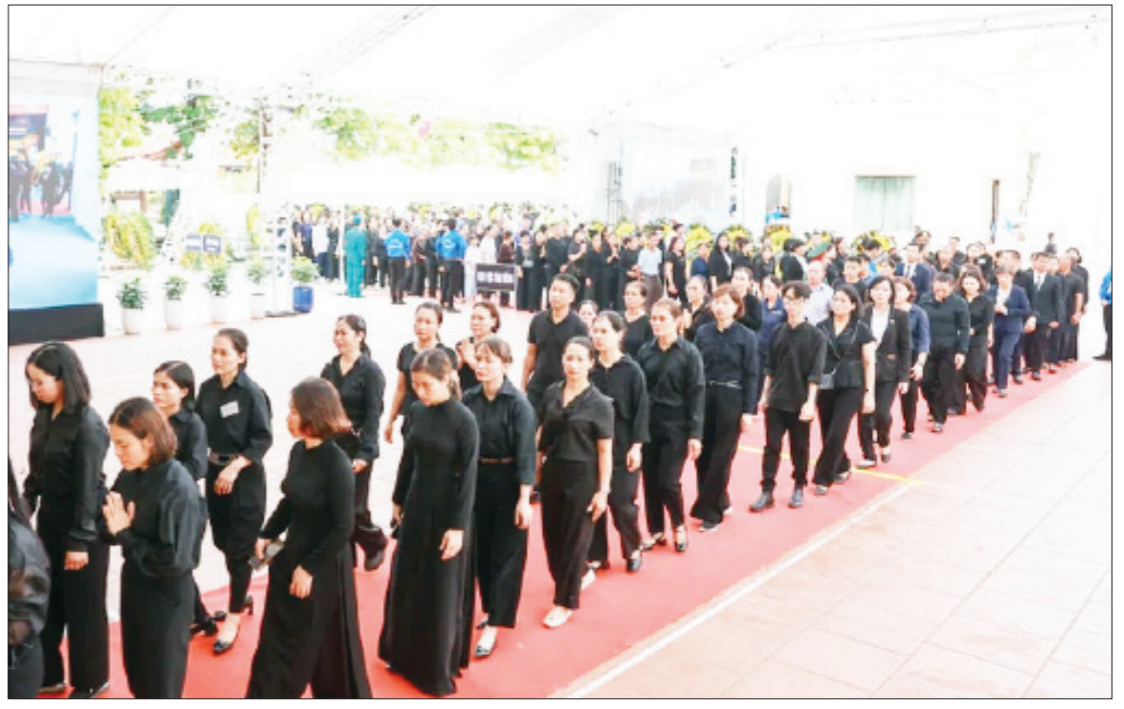
Hàng nghìn người dân xếp hàng vào viếng, thấp hương tưởng niệm Tổng Bí thư Nguyễn Phú Trọng tại quê hương Lại Đà (Đông Anh, Hà Nội).

Ghi sổ tang, Ủy viên Bộ Chính trị, Bí thư Trung ương Đảng, Chủ tịch Ủy ban Trung ương MTTQ Việt Nam Đỗ Văn Chiến xúc động viết: "Vô cùng thương tiếc đồng chí Tổng Bí thư Nguyễn Phú Trọng, Đoàn đại biểu Ủy ban Trung ương MTTQ Việt Nam xin thấp nén tâm nhang, kính cẩn nghiêng mình vĩnh biệt đồng chí Tổng Bí thư kính mến, người chiến sĩ Cộng sản kiên trung, người học trò xuất sắc của Chủ tịch Hồ Chí Minh vĩ đại, người lãnh đạo tài năng, kiệt xuất, nhà lý luận sắc bén, nhà văn hóa lớn... tiễn đưa đồng chí Tổng Bí thư Nguyễn Phú Trọng về nơi an nghỉ cuối cùng. Ủy ban Trung ương MTTQ Việt Nam, các thế hệ cán bộ công tác Mặt trận tư Trung ương đến cơ sở vô cùng đau xót trước sự ra đi của đồng chí Tổng Bí thư Nguyễn Phú Trọng. Đồng chí ra đi nhưng tên tuổi, sự nghiệp, tấm lòng nhân ái, trọng dân, thương dân,