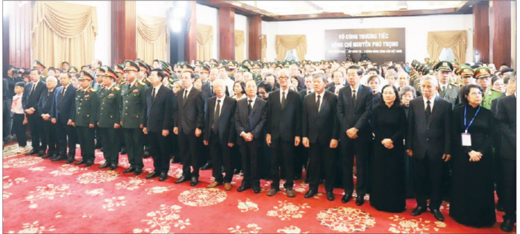
Lãnh đạo Thành phố Hồ Chí Minh viếng Tổng Bí thư Nguyễn Phú Trọng tại Hội trường Thống Nhất, ngày 25/7/2024.

Thay mặt Ban Chấp hành Trung ương về phòng, chống tham nhũng, tiêu cực, Ủy viên Bộ Chính trị, Thường trực Ban Bí thư Lương Cường, Phó Trưởng Ban Chỉ đạo xây dựng Đảng về phòng, chống tham nhũng, tiêu cực - Nhà lãnh đạo có uy tín, đặc biệt xuất sắc, tấm gương sáng ngời, mẫu mực về đạo đức cách mạng, trọn đời vì nước, vì dân. Với sự lãnh đạo, chỉ đạo sâu sát, quyết liệt, bài bản, kiên trì, không ngừng, không nghỉ, không có vùng cấm, không có ngoại lệ, nghiêm minh nhưng rất nhân văn của đồng chí Tổng Bí thư, Trưởng Ban Chỉ đạo, công tác phòng, chống tham nhũng, tiêu cực có bước tiến mạnh, đi vào chiều sâu, đạt nhiều kết quả, rất quan trọng, toàn diện, để lại dấu ấn tốt, tạo hiệu ứng tích cực, lan tỏa mạnh mẽ trong toàn xã hội và thực sự "đã trở thành