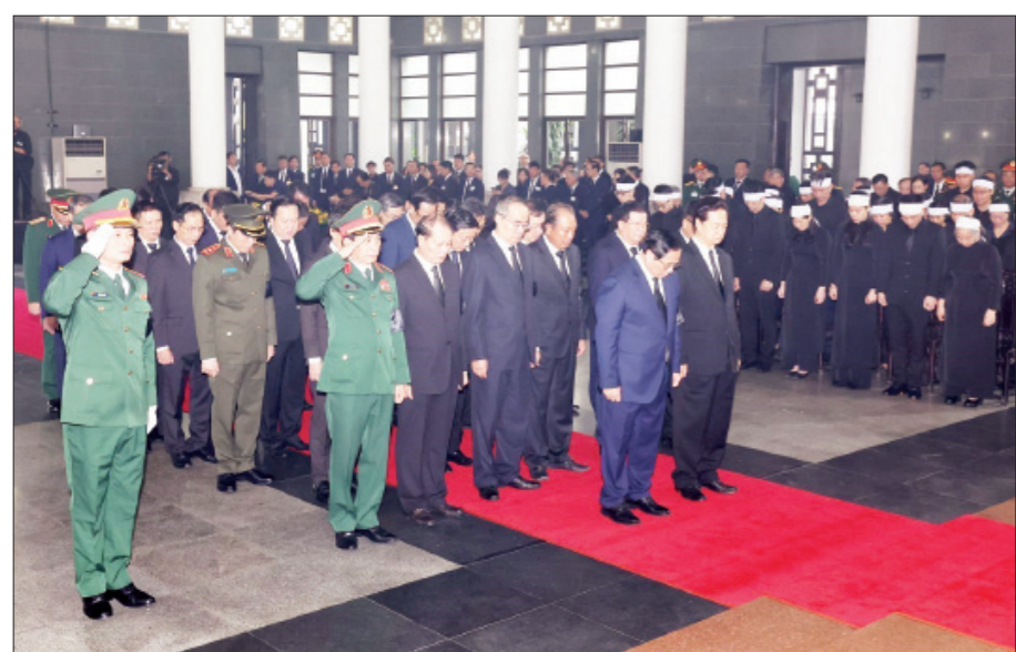
Đoàn Chính phủ do đồng chí Phạm Minh Chính, Ủy viên Bộ Chính trị, Thủ tướng Chính phủ làm Trưởng đoàn, kính viếng Tổng Bí thư Nguyễn Phú Trọng.