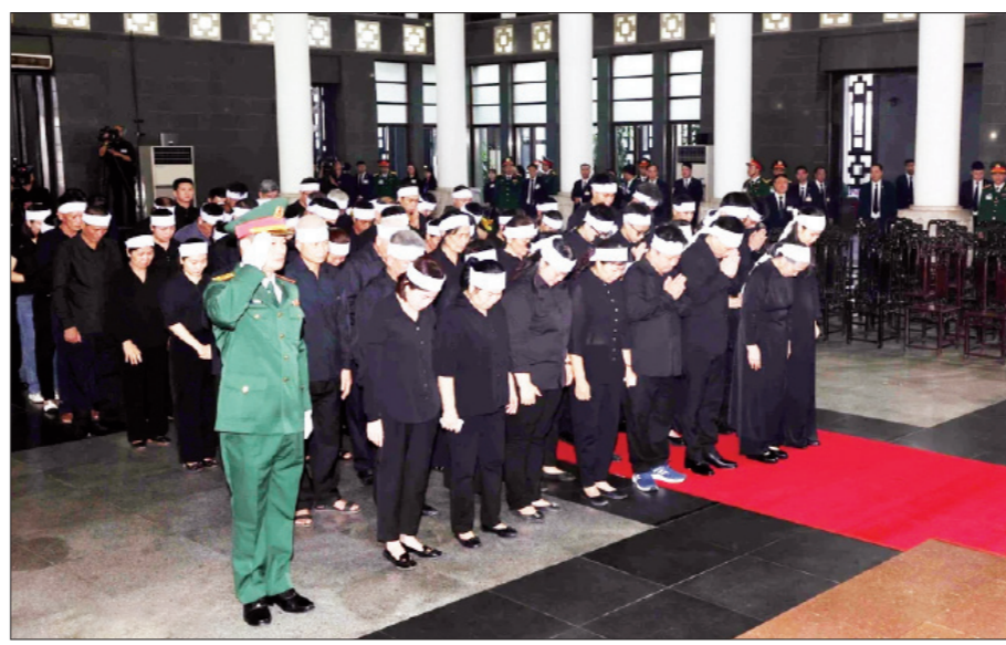
Đoàn gia đình, dòng họ viếng Tổng Bí thư Nguyễn Phú Trọng.

Trong niềm xúc động, tiếc thương sâu sắc, từ sáng sớm, các đoàn đại biểu Đảng, Nhà nước, Quốc hội, Chính phủ, MTTQ Việt Nam, các bộ, ban, ngành, cán bộ, chiến sĩ các lực lượng vũ trang cùng đông đảo tầng lớp nhân dân Thủ đô và nhiều tỉnh, thành phố trong cả nước và các đoàn đại biểu quốc tế đã tập trung tại khu vực Nhà Tang lễ Quốc gia - số 5 Trần Thánh Tông (Hà Nội) dự Lễ viếng Tổng Bí thư Nguyễn Phú Trọng - Nhà lãnh đạo đã có nhiều công lao to lớn, đặc biệt xuất sắc đối với sự nghiệp cách mạng vẻ vang của Đảng và dân tộc.