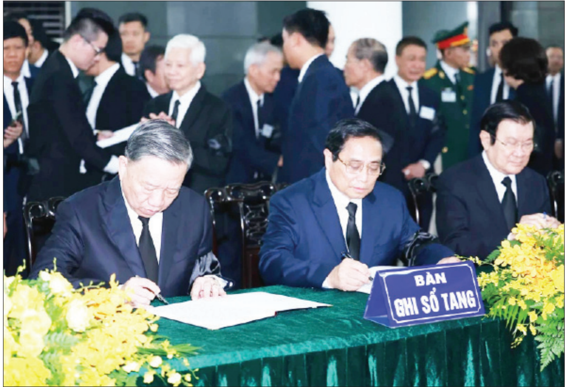
Các đồng chí lãnh đạo, nguyên lãnh đạo Đảng, Nhà nước ghi sổ tang.

(Tiếp theo trang 1) người đã dành trọn cuộc đời, tận tâm, tận lực, tận hiến cho đất nước, cho Đảng, cho Nhân dân; có nhiều công lao và cống hiến to lớn cho sự nghiệp cách mạng của Đảng và dân tộc, cho phong trào công sản quốc tế và duy trì hòa bình, ổn định, phát triển trong khu vực và trên thế giới. Kính cẩn nghiêng mình trước Anh linh của Đồng chí, chúng tôi nguyện học tập, noi gương Đồng chí, hết lòng, hết sức phụng sự Tổ quốc, phục vụ Nhân dân, đoàn kết, đồng lòng, nỗ lực phấn đấu thực hiện thành công mục tiêu xây dựng nước Việt Nam hòa bình, độc lập, thống nhất, dân chủ, giàu mạnh, văn minh, hạnh phúc mà Đồng chí trọn đời ấp ủ, phấn đấu hy sinh. Tôn tuối, sự nghiệp, nhân cách và những cống hiến to lớn của Đồng chí Tổng Bí thư Nguyễn Phú Trọng in đậm trong lòng Nhân dân, mãi mãi lưu danh trong lịch sử hào hùng của dân tộc Việt Nam văn hiến và anh hùng".