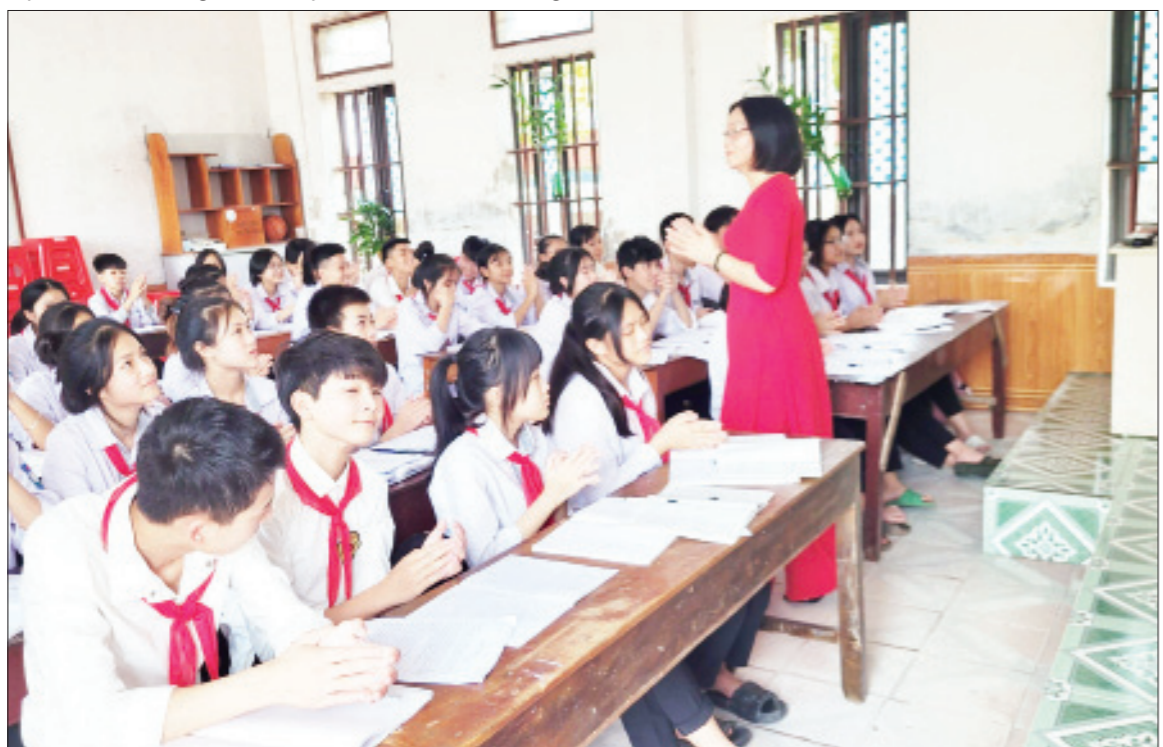
Một giờ học của cô và trò Trường THCS Nghĩa Hải (Nghĩa Hưng).

Đến nay, các trường học cơ bản hoàn thành công tác tuyển sinh, tiến hành rà soát lại cơ sở vật chất các lớp học đảm bảo bố trí đủ phòng học, phòng chức năng; tổng vệ sinh khuôn viên, tập huấn chuyên môn cho cán bộ, giáo viên... chuẩn bị các điều kiện cho năm học mới. 100% các trường trên toàn tỉnh đã sẵn sàng các điều kiện để bước vào năm học mới ■