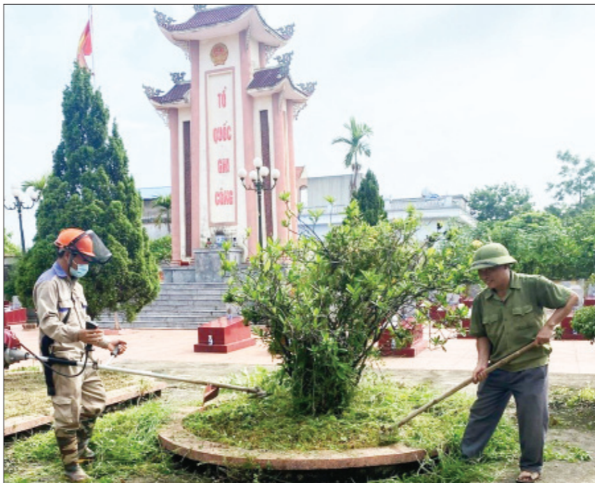
Cựu chiến binh xã Trục Đạo (Trực Ninh) tham gia chăm sóc Nghĩa trang liệt sĩ xã.

đạo 100% chi hội duy trì công tác bảo vệ môi trường gắn với phong trào thi đua "CCB gương mẫu", qua đó huy động đồng đội cán bộ, hội viên tham gia. Đồng thời, kêu gọi các cơ sở sản xuất, kinh doanh nói chung và các cơ sở do CCB làm chủ nói riêng tích cực giữ gìn vệ sinh, kiên quyết đấu tranh với những hành vi làm ảnh hưởng đến môi trường sinh thái. Qua đó tiếp tục khẳng định vai trò, vị trí của CCB trong phong trào chung tay xây dựng môi trường quê hương ngày càng văn minh, sáng - xanh - sạch - đẹp ■