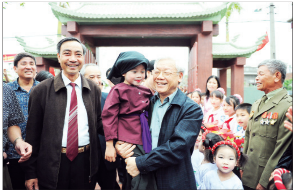
Tổng Bí thư Nguyễn Phú Trọng dự Ngày hội Đại đoàn kết toàn dân tộc tại khu dân cư xóm 4, xã Hải Bắc.

Ngày 11/11/2012, Tổng Bí thư Nguyễn Phú Trọng và Đoàn công tác của Trung ương về thăm, làm việc tại xã Hải Trung; dự Ngày hội Đại đoàn kết toàn dân tộc tại khu dân cư xóm 4, xã Hải Bắc (Hải Hậu). Chứng kiến sự khởi sắc của các vùng quê trong huyện, Tổng Bí thư Nguyễn Phú Trọng hoan nghênh các cấp ủy Đảng, chính quyền huyện Hải Hậu đã chú trọng đổi mới phương thức lãnh đạo của Đảng, xây dựng Đảng, hệ thống chính trị trong sạch, vững mạnh. Vận dụng sáng tạo những chủ trương của Đảng, chính sách pháp luật của Nhà nước vào thực tế địa phương; tập trung phát triển kinh tế, văn hóa, xã hội, đồng thời chăm lo cải thiện đời sống nhân dân, xây dựng Hải Hậu xứng danh "Vùng biển sáng Anh hùng".