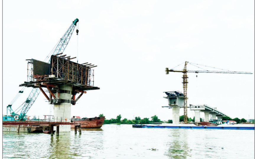
Cầu Đổng Cao nối liền 2 huyện Ý Yên và Nghĩa Hưng, kết nối giao thông hai bờ sông Đò đang được đẩy nhanh tiến độ để sớm đưa vào khai thác.

(Tiếp theo trang 1) So với nhiều địa phương khác trên cả nước, Nam Định có nguồn tài hạn chế. Ngân sách hạn hẹp là một trong những trở ngại không nhỏ cho những nhiệm vụ cần đầu tư lớn như CDS. Tuy nhiên, tỉnh đã có cách làm riêng khi triển khai thực hiện lộ trình CDS, vừa khắc phục khó khăn vừa đạt những kết quả rất tích cực ở những chỉ tiêu mà nhiều địa phương trên cả nước đang phấn đấu thực hiện. Đó là kết quả từ chủ trương đúng, thể chế kịp thời, tinh thần quyết liệt, đổi mới sáng tạo; các ngành, các địa phương hưởng ứng tích cực và sự đồng thuận tham gia của nhân dân ngay từ giai đoạn khởi động CDS.