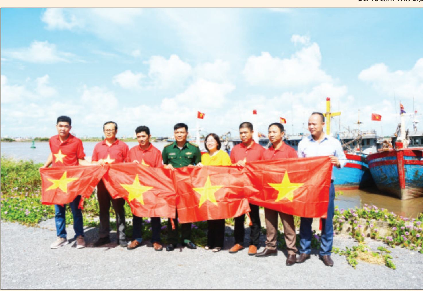
Chi cục Thủy sản (Sở Nông nghiệp và Phát triển nông thôn) phối hợp với Ban quản lý Cảng cá Ninh Cơ, Đồn Biên phòng của khẩu Cảng Hải Thịnh trao tặng cờ Tổ quốc cho ngư dân.

(Tiếp theo kỳ trước) Với mục tiêu cùng ngư dân tháo gỡ cảnh báo Thẻ vàng, giành lại Thẻ xanh, tỉnh Nam Định đang tập trung thực hiện quyết liệt, đồng bộ các biện pháp cùng với cả nước quyết tâm chống khai thác IUU để vượt qua đợt thanh tra lần thứ 5 của Ủy ban châu Âu (EC). Trong đó, trọng tâm là quản lý tốt đội tàu, giám sát sản lượng hải sản qua cảng cá, duy trì hoạt động thiết bị giám sát hành trình (VMS) và không để tàu cá "3 không" ra khơi... (Xem tiếp trang 3)