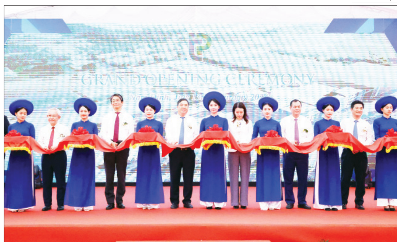
Các đồng chí lãnh đạo tỉnh cùng Thứ trưởng Bộ Ngoại giao Nguyễn Minh Hằng, Đại sứ đặc mệnh toàn quyền Nhật Bản tại Việt Nam Ito Naoki tham gia cắt băng khánh thành nhà máy Top Textiles.

Dự án Nhà máy dệt nhuộm Top Textiles được khởi công từ tháng 7/2022, đến nay đã hoàn thành đầu tư xây dựng giai đoạn 1 với công suất 60 triệu mét vải/năm (Theo đó công suất của nhà máy là 60 triệu mét vải, khổ 1,6m (bằng 96 triệu m 2 vải/năm), gấp 4 lần công suất của Nam Định hiện nay (công suất của Nam Định hiện nay là gần 15 triệu mét vải/năm). Dự