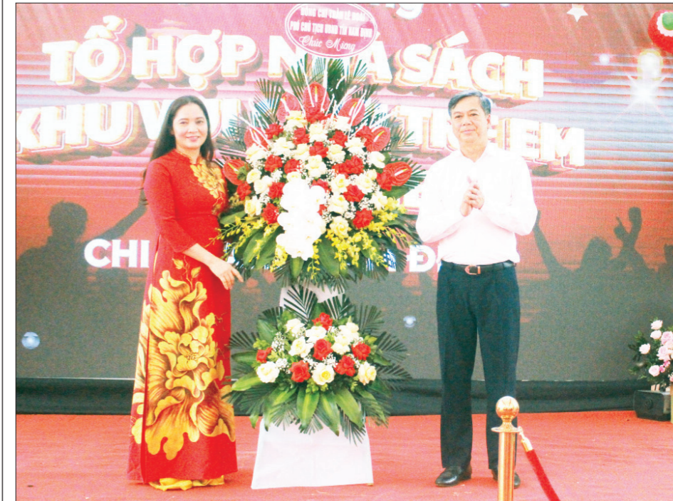
Đồng chí Phó Chủ tịch UBND tỉnh Trần Lê Đòai tặng hoa chúc mừng khai trương Tổ hợp Nhà sách Tân Việt và Khu vui chơi trẻ em.

Việt trong việc xây dựng môi trường văn hóa lành mạnh và bổ ích tại tỉnh Nam Định. Đồng chí cũng nhấn mạnh: Việc khai trương Nhà sách Tân Việt tại Nam Định không chỉ là niềm vui của riêng Nhà sách Tân Việt mà còn góp phần phát triển văn hóa đọc và cộng đồng đọc sách tại Nam Định. Sự có mặt của Nhà sách tại Nam Định góp phần làm phong phú thêm đời sống văn hóa và nâng cao chất lượng giáo dục của địa phương, bởi ở đây, mọi