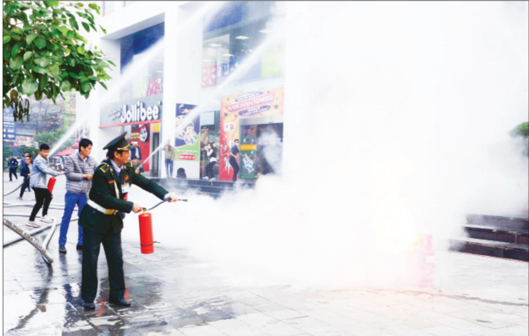
Phòng Cảnh sát phòng cháy, chữa cháy và cứu nạn, cứu hộ (Công an tỉnh) phối hợp với Công ty TNHH Thuận Thắng (thành phố Nam Định) diễn tập phương án chữa cháy, cứu nạn, cứu hộ.

Phát huy những kết quả đạt được, thời gian tới, Đảng ủy Phòng Cảnh sát PCCC-CNCH Công an tỉnh tiếp tục đẩy mạnh công tác tuyên truyền việc học tập và làm theo tư tưởng, đạo đức, phong cách Hồ Chí Minh bằng các nội dung, hình thức phù hợp, thiết thực. Trong đó đẩy mạnh việc làm theo những điều Bác Hồ dạy gắn với các nhiệm vụ chính trị của đơn vị, góp phần không ngừng nâng cao chất lượng, hiệu quả các mặt công tác./. Bài và ảnh: XUÂN THU