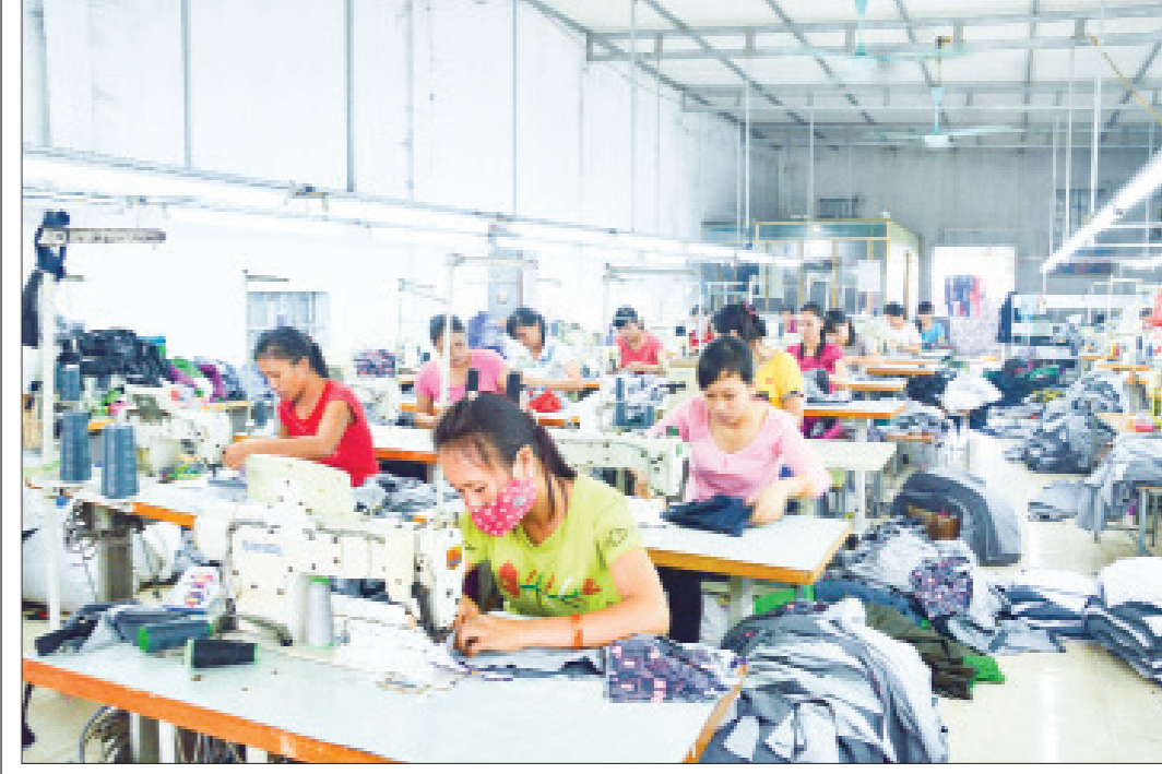
Cơ sở may Cường Thịnh, xóm 4, xã Giao Hương tạo việc làm, thu nhập ổn định cho 50 lao động.

cận các dịch vụ xã hội cơ bản, được vay vốn tín dụng ưu đãi từ các hệ thống Ngân hàng Chính sách xã hội. Hỗ trợ xây dựng, nhân rộng mô hình dự án giảm nghèo, hỗ trợ phát triển kinh doanh, tạo sinh kế, việc làm, thu nhập cho các đối tượng trong diện; ưu tiên hỗ trợ hộ nghèo có thành viên là người có công với cách mạng, trẻ em, người khuyết tật, phụ nữ thuộc hộ nghèo, cận nghèo hoặc hộ mới thoát nghèo.