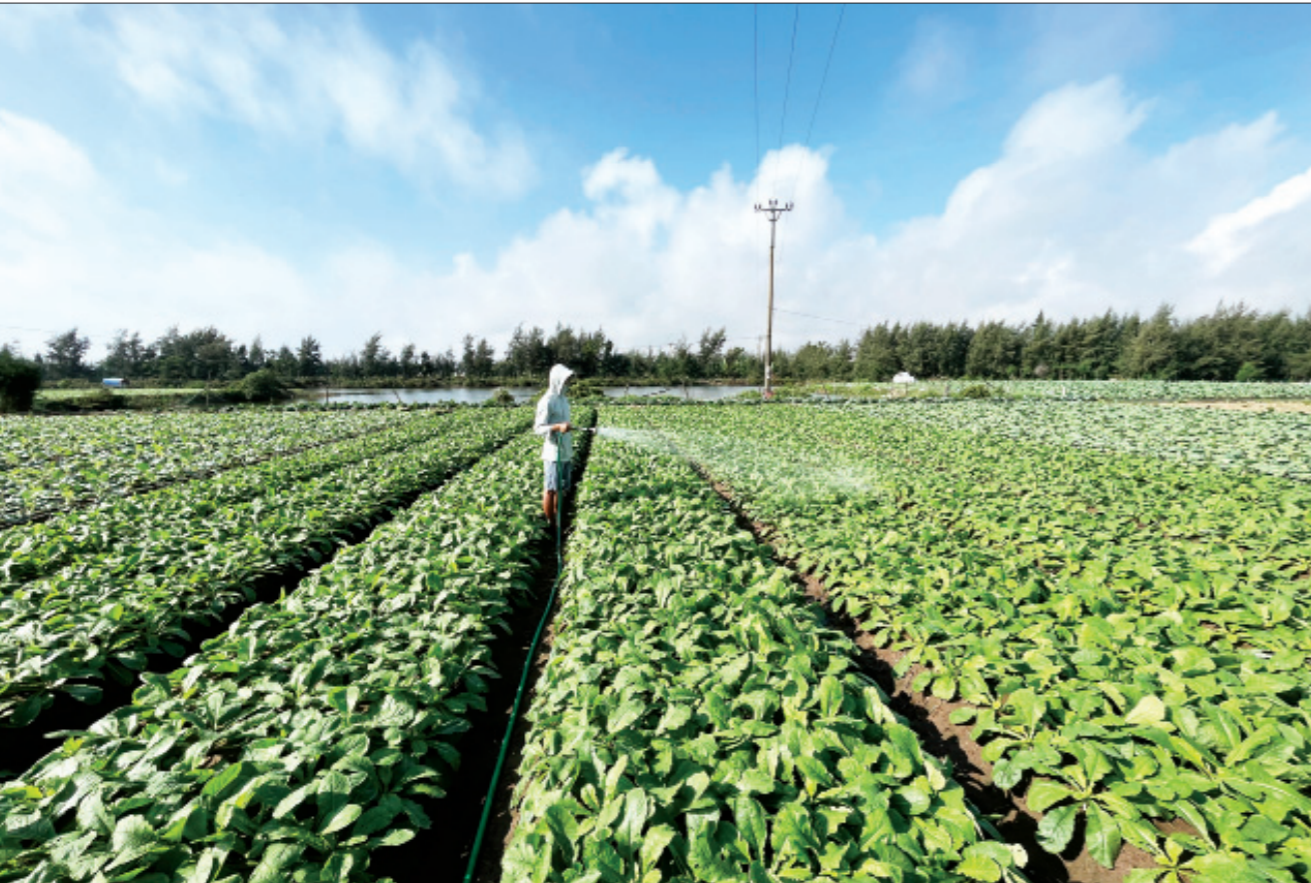
Nông dân thị trấn Thịnh Long sản xuất rau màu theo hướng nông nghiệp hữu cơ mang lại nguồn thu ổn định.

Xác định công tác giảm nghèo bền vững là một trong những nhiệm vụ quan trọng, góp phần thúc đẩy phát triển kinh tế - xã hội, thời gian qua, huyện Giao Thủy đã triển khai đồng bộ các giải pháp thực hiện hiệu quả Chương trình mục tiêu quốc gia giảm nghèo bền vững, từng bước giảm tỷ lệ hộ nghèo, tránh tái nghèo, tăng thu nhập, cải thiện đời sống nhân dân.