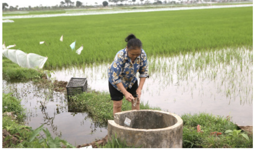
Nông dân xã Bình Minh (Nam Trực) bỏ vỏ thuốc bảo vệ thực vật vào bể chứa bê tông.