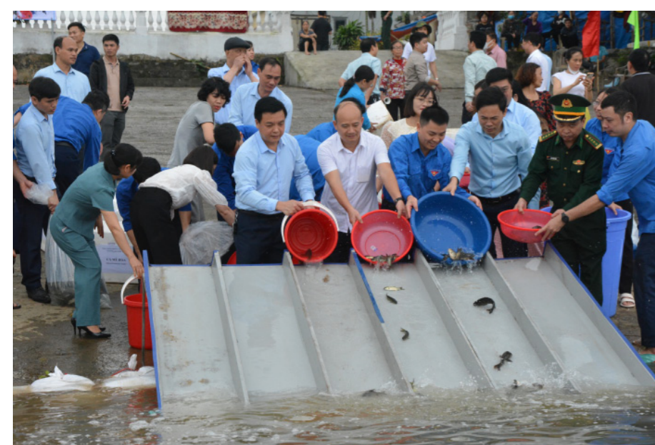
Đại diện lãnh đạo một số sở, ngành và người dân tham gia thả phóng sinh góp phần tái tạo nguồn lợi thủy sản.

Nam Định có 72km đường bờ biển và 4 con sông lớn chảy qua nên NLTS đa dạng phong phú, một số loài có giá trị kinh tế cao, tạo điều kiện thuận lợi để phát triển sản xuất thủy sản nâng cao thu nhập, góp phần bảo đảm đời sống của cộng đồng dân cư. Nhờ định hướng phù hợp và những giải pháp căn cơ, giá trị sản xuất của ngành thủy sản của tỉnh ta luôn có sự tăng trưởng. Đồng thời các đổi tượng khai thác, nuôi trồng cũng tiếp tục mở rộng, hướng đến những con nuôi có giá trị kinh tế cao, phù hợp với xu hướng thị trường và thị hiếu của người tiêu dùng. Năm 2023, tổng sản lượng thủy sản của tỉnh đạt 194.980 tấn, giá trị sản xuất thủy sản đạt 9.790 tỷ đồng (giá