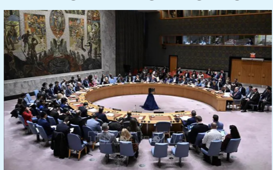
Toàn cảnh phiên họp khẩn của Hội đồng Bảo an LHQ.