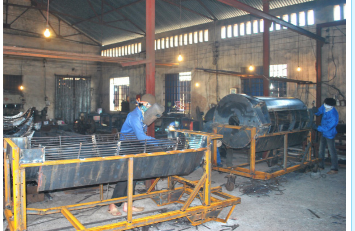
Sản xuất tại Công ty TNHH Cơ khí Đình Mộc, xã Xuân Kiên (Xuân Trường). Bài và ảnh: NGỌC LINH