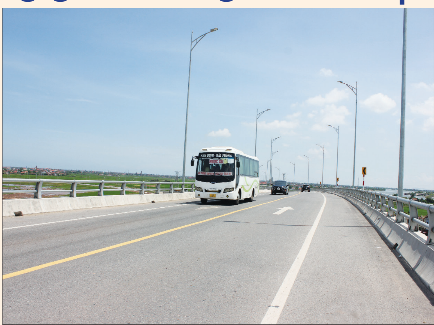
Cầu vượt cụm công trình Kênh và Âu tàu Nghĩa Hưng vừa được hoàn thành và đưa vào khai thác.

Mạng lưới đường bộ của tỉnh đã được hình thành theo dạng đường xuyên tâm có đường vành đai. Các trục Quốc lộ (QL) 10, 21, 21B và 38B đều đi qua trung tâm thành phố Nam Định; các đường tỉnh hầu hết cũng đều có hướng từ trung tâm thành phố tỏa ra các huyện, thị; các trục liên vùng, nội tỉnh, đường giao thông nông thôn kết nối với các huyện, xã, thôn và có tỷ lệ rải nhựa cao. Hệ thống giao thông vừa đa dạng, vừa có tính liên hoàn kết nối nhiều hình thức vận tải đường bộ, đường thủy nội địa, đường biển, đường sắt nên thuận lợi cho phát triển giao thương hàng hóa và phục vụ nhu cầu đi lại của nhân dân. Hệ thống đường bộ huyết mạch đã được cải tạo, nâng cấp. Hầu hết các tuyến QL, tỉnh lộ có kết cấu mặt đường đạt tiêu chuẩn cấp cao A1; các điểm vượt sông trên tuyến có cầu cứng lớn thuận lợi cho phương tiện tải trọng lớn hoạt động. Sở đã tham mưu cho tỉnh