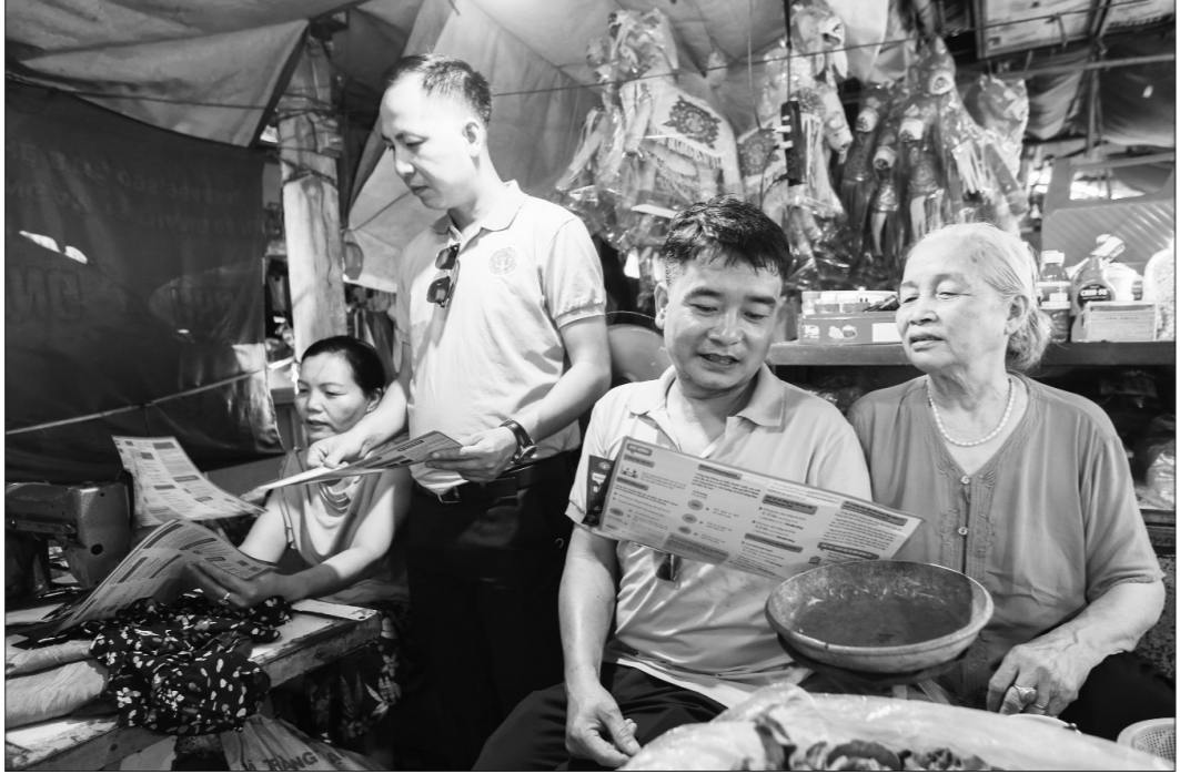
Cán bộ Bảo hiểm xã hội tỉnh tuyên truyền cho người dân về chính sách bảo hiểm y tế.