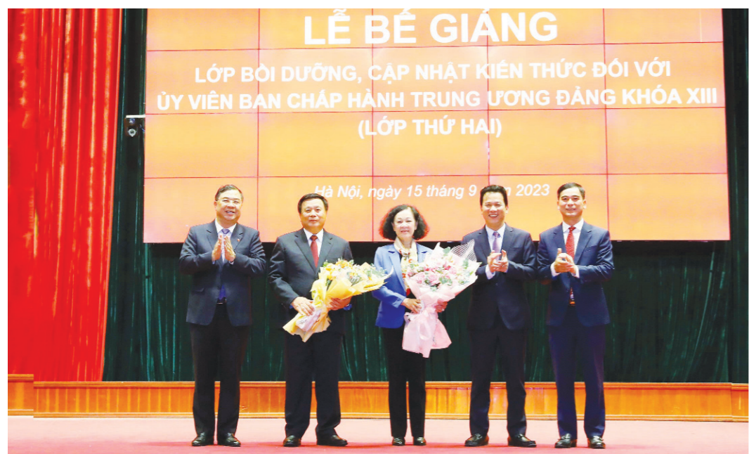
Ban tổ chức lớp bồi dưỡng tặng hoa cho các đồng chí Ủy viên Bộ Chính trị: Trương Thị Mai, Thường trực Ban Bí thư, Trưởng Ban Tổ chức Trung ương; Nguyễn Xuân Thắng, Giám đốc Học viện Chính trị Quốc gia Hồ Chí Minh, Chủ tịch Hội đồng Lý luận Trung ương.

Chiều 15-9, tại Hà Nội, Học viện Chính trị quốc gia Hồ Chí Minh phối hợp Ban Tổ chức Trung ương tổ chức bế giảng lớp bồi dưỡng, cập nhật kiến thức đối với Ủy viên Ban Chấp hành Trung ương Đảng khóa XIII (lớp thứ hai).