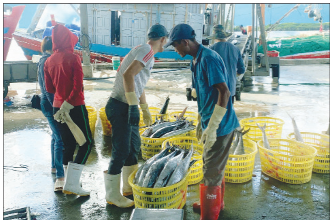
Việc kiểm tra, giám sát sản lượng thủy sản tại Cảng cá Thành Vui (Hải Hậu) được tăng cường thực hiện.

Thực hiện chỉ đạo của Tỉnh uỷ, UBND tỉnh, Ban Chỉ đạo 67-IUU tỉnh, Sở NN và PTNT đã chủ động phối hợp với các sở, ngành, các huyện ven biển thành lập các đoàn, tổ công tác liên ngành kiểm tra, hướng dẫn khắc phục, xử lý dứt điểm các sai phạm, hạn chế, bất cập liên quan đến chống khai thác IUU tại địa phương; xây dựng kế hoạch, nội dung, chương trình làm việc đảm bảo mọi điều kiện tốt nhất để đón và làm việc với đoàn thanh tra lần 4 của EC, dự kiến vào tháng 10-2023. Bên cạnh đó, Văn phòng đại diện thanh tra, kiểm tra, kiểm soát nghề cá xây dựng quy trình kiểm tra, kiểm soát tàu cá cập cảng, rời cảng; ban hành quy chế làm việc và phân công lực lượng thường trực 24/24h để phục vụ ngư dân và tàu cá làm các thủ tục cần thiết, khắc phục tâm lý ngại phiền hà của ngư dân, chủ tàu; phối hợp tuyên truyền, trực tiếp xuống tàu hướng dẫn ngư dân về các quy định của Luật Thủy sản, các văn bản hướng dẫn thi hành nhằm thay đổi tư duy, nhận thức và thói quen khai thác của ngư dân, hướng tới hoạt động nghề cá có trách nhiệm, hiệu quả và bền