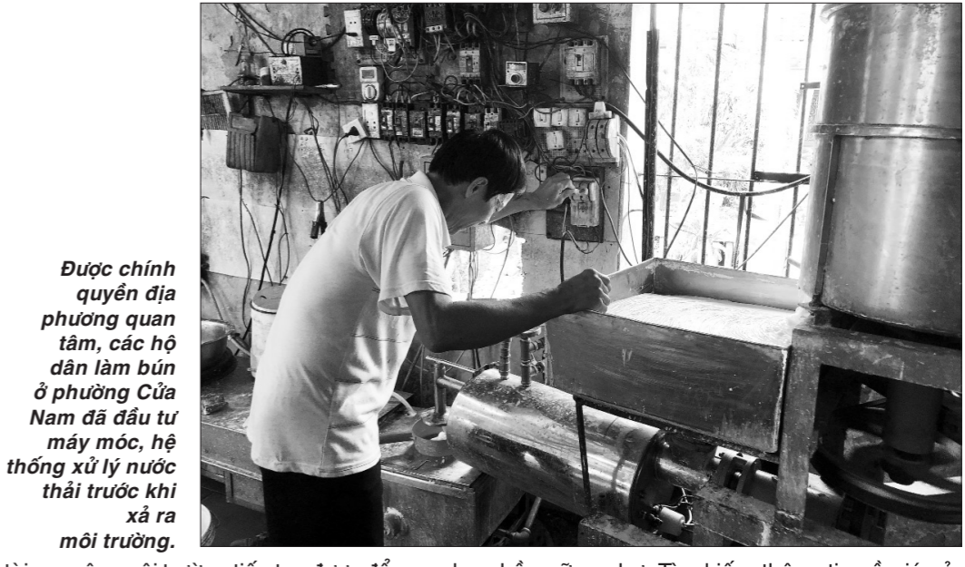
Được chính quyền địa phương quan tâm, các hộ dân làm bún ở phường Cửa Nam đã đầu tư máy móc, hệ thống xử lý nước thải trước khi xả ra môi trường.

tài nguyên, môi trường tiếp tục được đẩy mạnh với các phong trào như "Hưởng ứng chiến dịch làm cho thế giới sạch hơn năm 2023"; "Hưởng ứng Ngày Quốc tế đa dạng sinh học"... UBND phường thành lập tổ công tác ra quân lập lại trật tự đô thị, vệ sinh môi trường, trật tự an toàn giao thông và phân công nhiệm vụ cho các thành viên tổ công tác. Cùng với đó, các hội, đoàn thể trên địa bàn phường cũng tích cực tham gia các phong trào, hoạt động bảo vệ môi trường. Vào các ngày chủ nhật hàng tuần, hội viên Hội Phụ nữ xuống đường chung tay dọn dẹp vệ sinh môi trường các điểm công cộng, cắt tỉa cây hai bên đường... Đoàn Thanh niên phường thường xuyên ra quân bảo vệ môi trường bằng các việc làm cụ thể như: tuyên truyền nâng cao ý thức cho người dân; cùng với các hội, đoàn thể dọn vệ sinh khu vực bãi rác trên tỉnh lộ 490C để đảm bảo vệ sinh môi trường và tổ chức cắt tỉa cây hai bên đường Long Quán để các phương tiện giao thông đi lại không bị khuất tầm nhìn; gỡ bỏ những quảng cáo sai quy định trên các cột điện, thân cây, vẽ hoa trang trí trên các cột điện, vừa hạn chế việc dán quảng cáo sai quy định, vừa tạo mỹ quan đô thị... Hội Nông dân phường nhận thu gom rác thải trong các khu dân cư; thu gom bao bì thuốc bảo vệ thực vật; trồng mới, bảo vệ và chăm sóc hàng cây nông dân; xây dựng tuyến đường không có rác thải... Bên cạnh đó, UBND phường đã tổ chức ký cam kết với 68 hộ kinh doanh ở khu vực mặt đường chấp hành nghiêm các quy định trật tự đô thị, vệ sinh môi trường trên địa bàn.