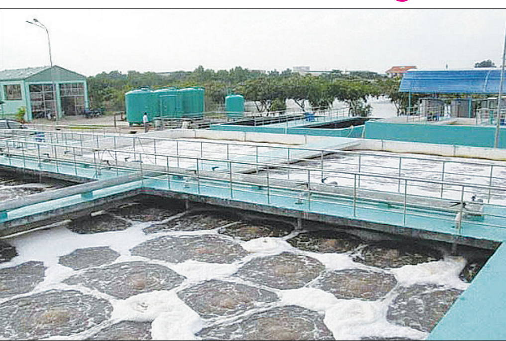
Xây dựng hệ thống xử lý nước thải hiện đại tại các khu công nghiệp là một trong những giải pháp hiệu quả giảm phát thải khí methal.

Tuy nhiên các nhà khoa học cho rằng, phần lớn các nước đang không đi đúng tiến độ trong việc đạt mục tiêu khí thải vào năm 2030, chứ chưa tính đến năm 2050. Wood Mackenzie nhận định, để giảm phát thải carbon trong ngành năng lượng, thế giới cần đầu tư 1.900 tỷ USD/năm để hạn chế mức tăng nhiệt độ của trái đất. Khoảng 75% số tiền trong khoản đầu tư này cần tập trung vào các ngành điện và hạ tầng.