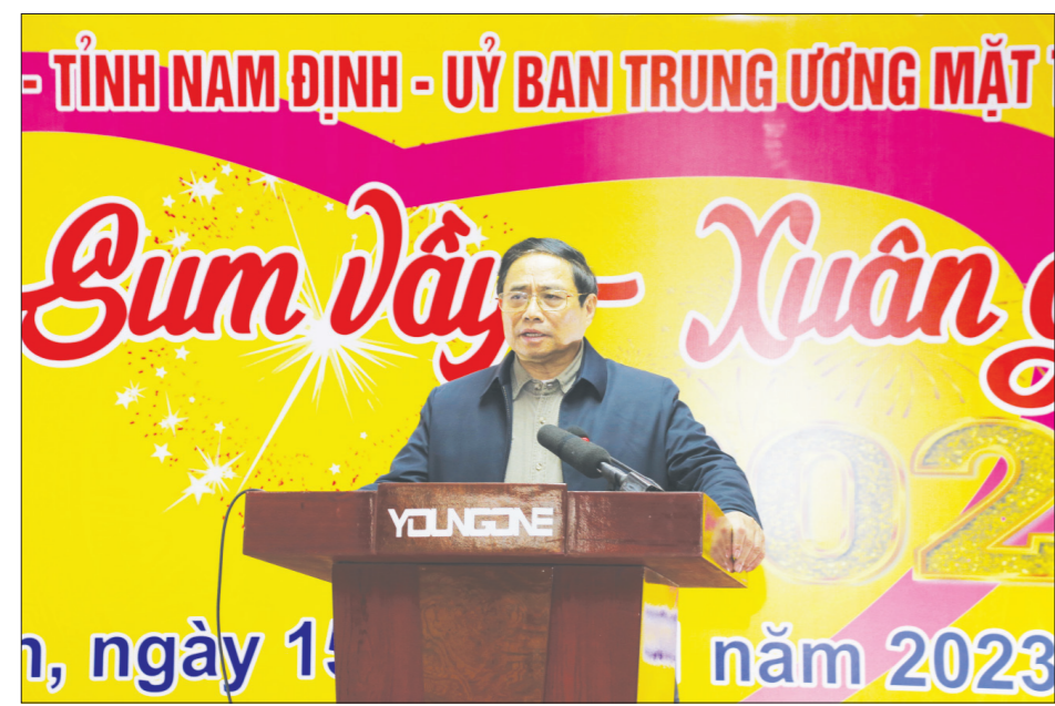
Thủ tướng Chính phủ Phạm Minh Chính phát biểu tại chương trình "Tết sum vầy - Xuân gắn kết".