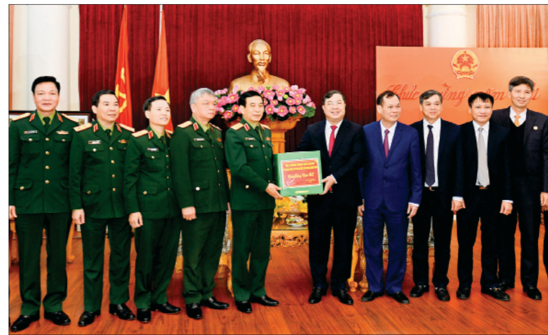
Đại tướng Phan Văn Giang, Ủy viên Bộ Chính trị, Phó Bí thư Quân ủy Trung ương, Bộ trưởng Bộ Quốc phòng tặng quà chúc Tết tỉnh Nam Định.