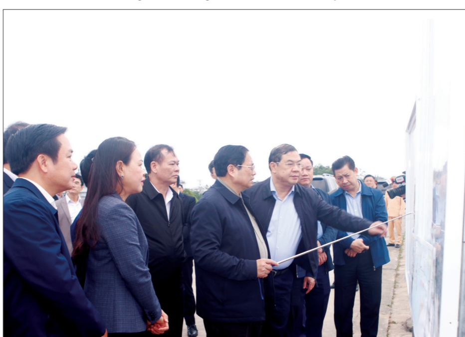
Thủ tướng Chính phủ Phạm Minh Chính và lãnh đạo 3 tỉnh Nam Định, Thái Bình, Ninh Bình kiểm tra thực địa dự án Tuyến đường cao tốc Thái Bình - Nam Định - Ninh Bình tại địa bàn xã Nghĩa Trung (Nghĩa Hưng).

khoa học công nghệ và đổi mới sáng tạo. Thủ tướng Chính phủ chỉ đạo tỉnh đẩy mạnh khai thác tiềm năng, thế mạnh vùng kinh tế biển trở thành vùng kinh tế động lực, có bước phát triển nhanh, bền vững; tập trung mở rộng không gian du lịch, tăng cường xúc tiến, quảng bá và đào tạo nguồn nhân lực, phát triển đa dạng các chuỗi sản phẩm, thương hiệu du lịch, nhất là các sản phẩm du lịch biển, du lịch làng nghề. Tập trung huy động các nguồn lực, giải quyết các điểm nghẽn, đẩy nhanh tiến độ đầu tư xây dựng hạ tầng cho phát triển công nghiệp, nhất là các khu, cụm công nghiệp; thu hút các doanh nghiệp lớn đầu tư vào các ngành công nghiệp có thế mạnh, công nghệ hiện đại, giá trị gia tăng cao, đóng góp lớn cho nguồn thu ngân sách. Tỉnh cần ưu tiên bố trí đầu tư cho phát triển kết cấu hạ tầng có sức lan tỏa lớn; sớm hoàn thành một số công trình trọng điểm, có tính chiến lược lâu dài làm động lực quan trọng thúc đẩy thu hút đầu tư và phát triển kinh tế - xã hội. Trong đó, không đầu tư dàn trải, đẩy nhanh tiến độ hoàn