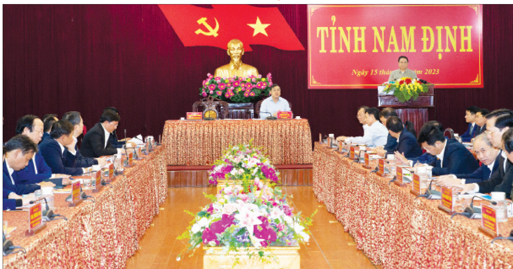
Quang cảnh buổi làm việc của Thủ tướng Chính phủ Phạm Minh Chính với tỉnh Nam Định.