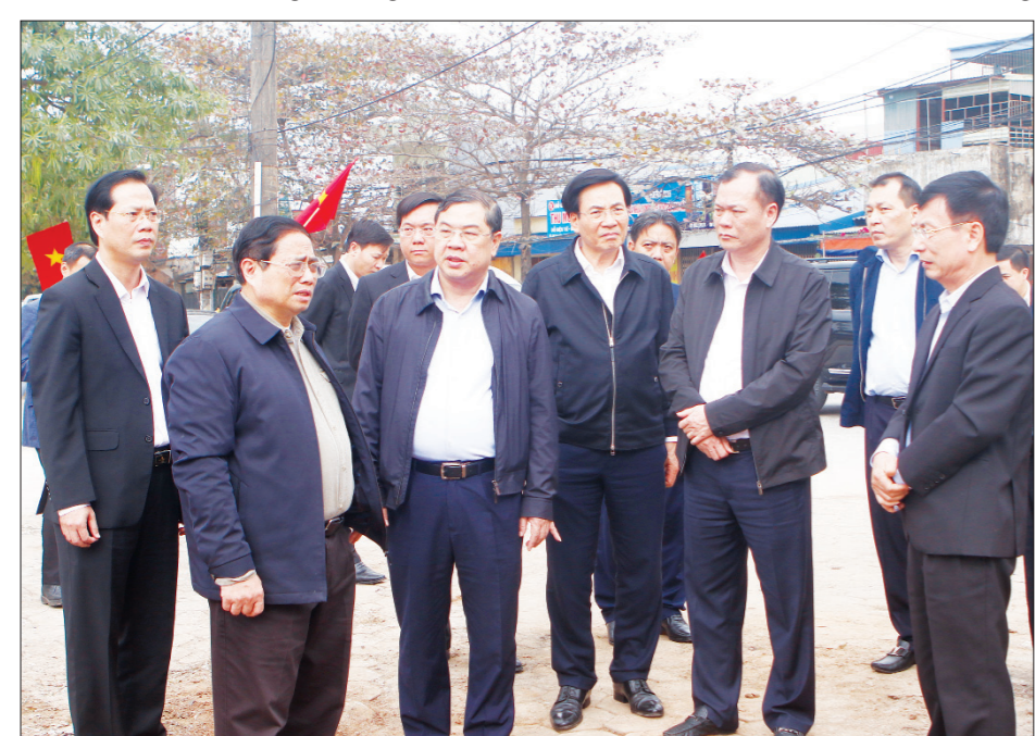
Thủ tướng Chính phủ Phạm Minh Chính và các đồng chí lãnh đạo tỉnh kiểm tra thực địa công trình Dự án xây dựng cầu qua sông Đào nối từ đường Song Hà đến đường Vũ Hữu Lợi (thành phố Nam Định).

Kết luận buổi làm việc, Thủ tướng Chính phủ Phạm Minh Chính ghi nhận, đánh giá cao kết quả thực hiện nhiệm vụ chính trị của tỉnh thời gian qua, những định hướng phát triển trong thời gian tới. Trong đó, tỉnh đã làm tốt công tác kiểm soát dịch bệnh COVID-19 và các dịch bệnh khác; nhất là tiêm vắc-xin. Tốc độ tăng trưởng GRDP của tỉnh năm 2022 cao hơn mức tăng