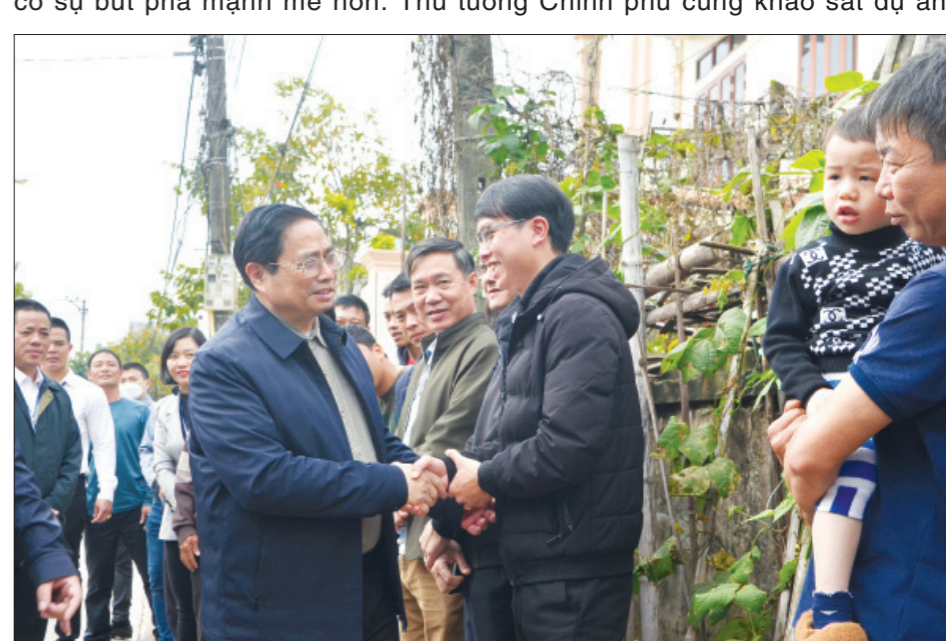
Thủ tướng Chính phủ Phạm Minh Chính ân cần thăm hỏi và chúc Tết người dân xã Nam Vân (thành phố Nam Định).

* Trong chương trình thăm và làm việc tại Nam Định, Thủ tướng Chính phủ Phạm Minh Chính và lãnh đạo 3 tỉnh Nam Định, Ninh Bình, Thái Bình đã kiểm tra thực địa dự án tuyến đường cao tốc Thái Bình, Nam Định, Ninh Bình tại địa phận xã Nghĩa Trung (Nghĩa Hưng). Thủ tướng Chính phủ Phạm Minh Chính đã nêu bật vai trò quan trọng của dự án đối với sự phát triển kinh tế - xã hội, an ninh - quốc phòng của các tỉnh liên quan. Đặc biệt với tỉnh Nam Định, khi dự án hoàn thành sẽ tạo tiền đề quan trọng để tỉnh có sự bứt phá mạnh mẽ hơn. Thủ tướng Chính phủ cũng khảo sát dự án