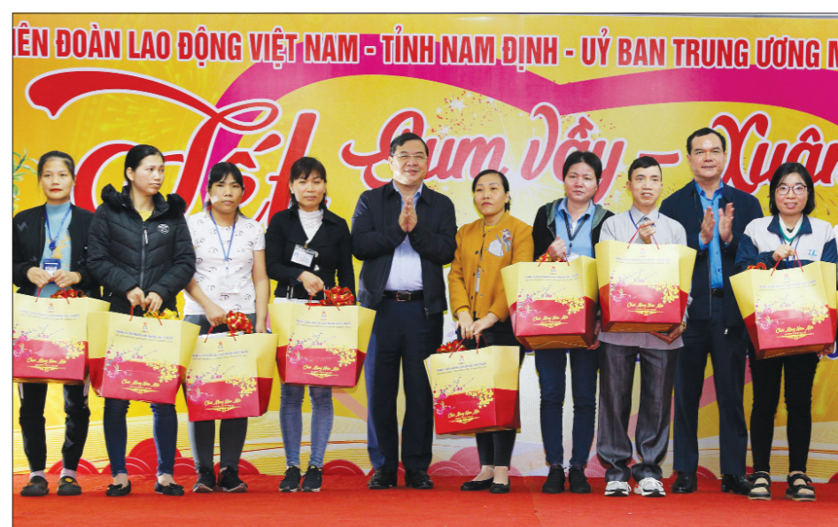
Đoàn công tác của Thủ tướng Chính phủ và các đồng chí lãnh đạo tỉnh trao quà cho công nhân có hoàn cảnh khó khăn.