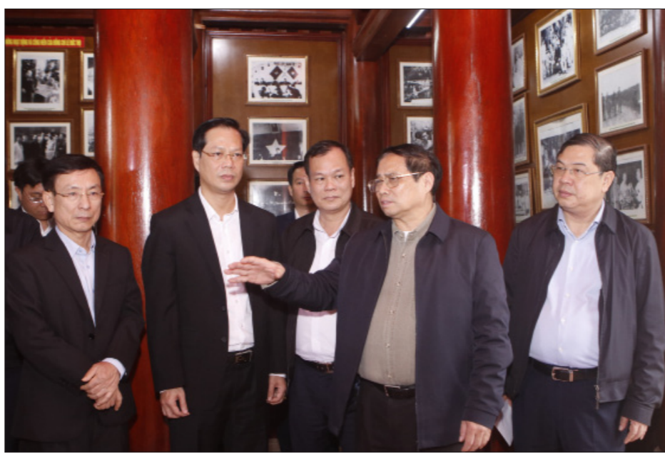
Thủ tướng Chính phủ Phạm Minh Chính và các đồng chí lãnh đạo tỉnh thăm Khu tưởng niệm đồng chí Lê Đức Thọ tại xã Nam Vân (thành phố Nam Định).