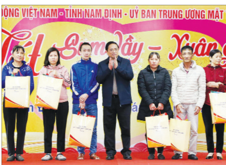
Thủ tướng Chính phủ Phạm Minh Chính trao quà Tết cho các gia đình có hoàn cảnh khó khăn.

Trên cơ sở phân tích tình hình, đưa ra các quan điểm chỉ đạo, điều hành, Thủ tướng Chính phủ Phạm Minh Chính đề nghị tỉnh Nam Định thực hiện một số nhiệm vụ cơ bản để tỉnh phát huy được tiềm năng, thế mạnh, thúc đẩy phát triển. Trong đó tiếp tục triển khai đồng bộ, hiệu quả các nghị quyết của Trung ương Đảng, Quốc hội, Chính phủ và của tỉnh; thực hiện Chương trình phục hồi và phát triển kinh tế - xã hội và các Chương trình mục tiêu quốc gia; tiếp tục phòng, chống, kiểm soát tốt dịch bệnh; tập trung xây dựng, sớm hoàn thành lập Quy hoạch tỉnh đến năm 2030, tầm nhìn đến năm 2050 và tổ chức quản lý, thực hiện tốt các loại quy hoạch trên địa bàn. Cùng với đó, tỉnh phải đẩy mạnh chuyển dịch mạnh mẽ cơ cấu kinh tế gắn với đổi mới mô hình tăng trưởng, chú trọng phát triển nông nghiệp sạch, chuyển hướng mạnh phát triển công nghiệp hiện đại dựa trên nền tảng