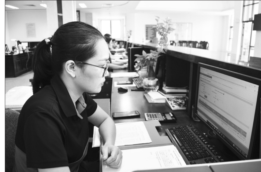
Cán bộ Kho bạc Nhà nước Nam Định kiểm tra tiến độ công việc trên hệ thống dịch vụ công trực tuyến.

Nhận thức rõ tầm quan trọng của công tác thanh tra, kiểm tra trong hoạt động nghiệp vụ, Kho bạc Nhà nước (KBNN) Nam Định đã quán triệt toàn hệ thống triển khai thanh tra, kiểm tra có trọng tâm, trọng điểm, đồng thời tiếp tục tăng cường ứng dụng công nghệ thông tin nhằm cải cách, hiện đại hóa thanh tra, kiểm tra theo Chiến lược phát triển KBNN đến năm 2023.