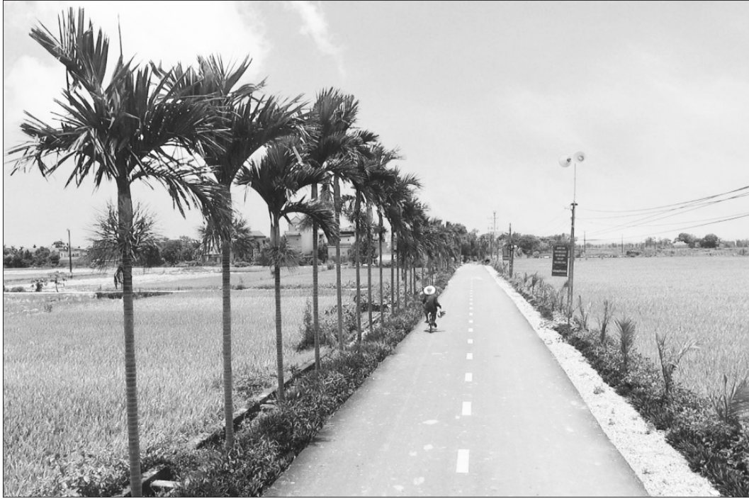
Nông thôn mới xã Hợp Hưng.

lớn; có mô hình thu gom và xử lý nước thải sinh hoạt trong khu dân cư trước khi thải ra kênh mương; hàng tháng, xóm, tổ dân phố tổ chức tự chấm điểm và đôn đốc các gia đình duy trì việc chỉnh trang khuôn viên gia đình và nơi công cộng. Bên cạnh đó, các địa phương cũng tích cực triển khai thực hiện mô hình “Phân loại rác thải sinh hoạt và xử lý rác thải hữu cơ tại hộ gia đình”; các cấp, ngành, các tổ chức đoàn thể chính trị xã hội và nhân dân tích cực hưởng ứng, đồng ký tham gia thực hiện bằng các hình thức sử dụng hố ủ (đối với nhà có vườnร่อง) hoặc ủ bằng thùng, xô... Đến nay, toàn huyện đã có 37.025/39.085 gia đình (đạt 94,7%) tham gia thực hiện phân loại chất thải rắn sinh hoạt tại nguồn. Tuy nhiên, trong quá trình thực hiện, các xã, thị trấn gặp không ít vướng mắc trong việc thu gom, xử lý chất thải rắn và chất thải nguy hại. Đối với các hộ đã thực hiện phân loại nhưng không thu xử lý rác thải hữu cơ rất khó trong công tác thu gom, xử lý do địa phương thiếu kinh phí đầu tư trang thiết bị các phương tiện, máy móc cũng như hệ thống lò đốt (đối với xã sử dụng công nghệ xử lý rác thải bằng lò đốt) và mua các chế phẩm sinh học để