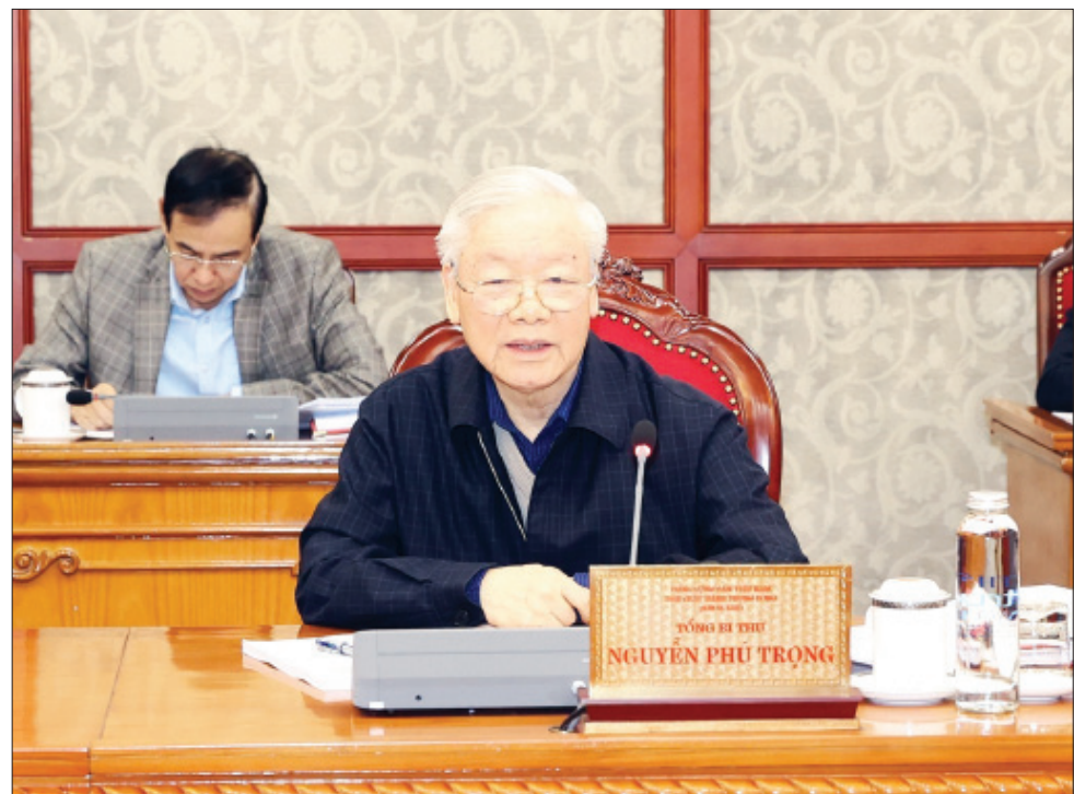
Tổng Bí thư Nguyễn Phú Trọng phát biểu kết luận cuộc họp.

Đoàn công tác của Bộ Kế hoạch và Đầu tư kiểm tra tiến độ một số dự án trên địa bàn tỉnh