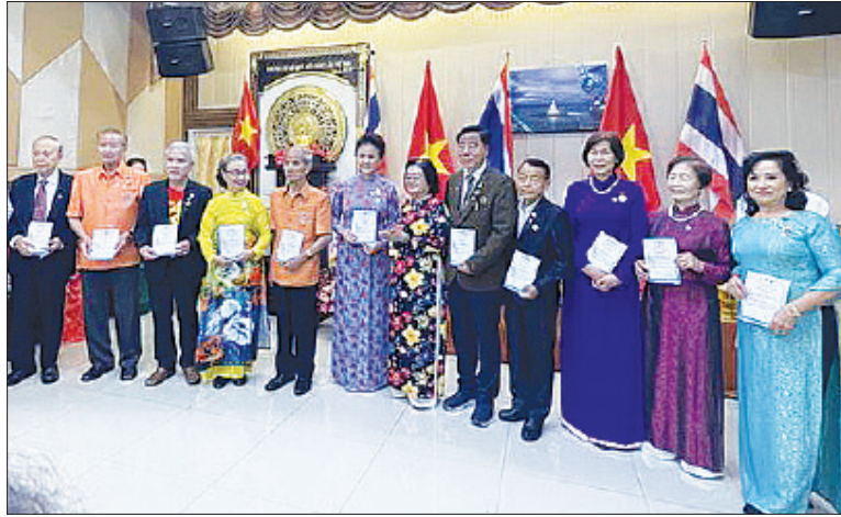
Nguyên Phó Chủ tịch nước Trương Mỹ Hoa trao chứng nhận hội viên Câu lạc bộ "Vi Hoàng Sa - Trường Sa thân yêu" cho các kiều bào tại Udon Thani.

tập thể và trao chứng nhận hội viên cho 33 kiều bào tỉnh Udon Thani. Bà Trương Mỹ Hoa chúc mừng tập thể, cá nhân và kiều