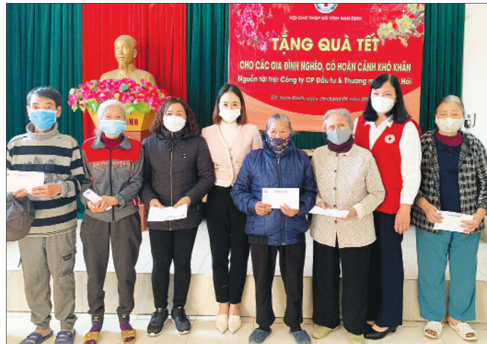
Hội Chữ thập đỏ thành phố Nam Định phối hợp với các nhà tài trợ tặng quà cho người nghèo, người có hoàn cảnh khó khăn trên địa bàn thành phố.