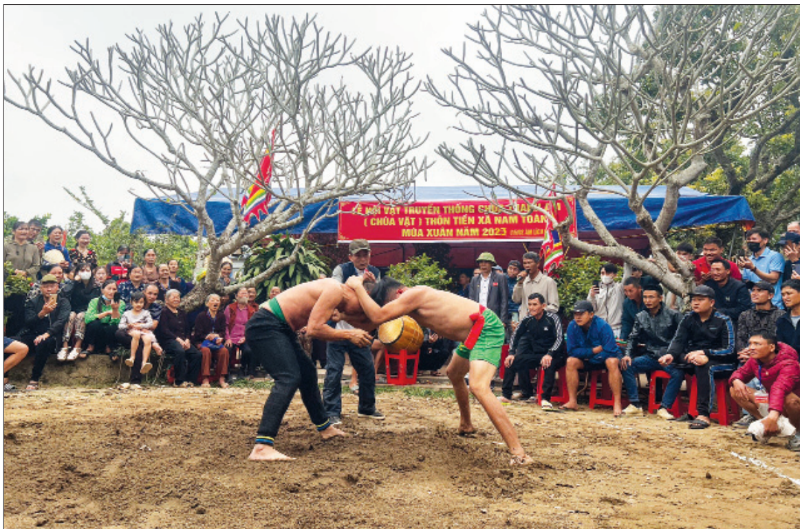
Đấu vật chầu Thánh tại Chùa Thanh Am, xã Nam Toàn (Nam Trực).