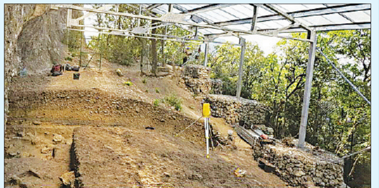
Khai quật khảo cổ ở lối vào của hang Grotte Mandrin ở miền Nam nước Pháp.

Nghiên cứu mới dựa trên bằng chứng được tìm thấy tại hang đá Grotte Mandrin, miền Nam nước Pháp. Khu vực này được khai phá lần đầu vào năm 1990, bao gồm nhiều lớp di tích khảo cổ có niên đại hơn 80 nghìn năm. Các tác giả cho biết một lớp gọi là "Lớp E" cho thấy sự xuất hiện của người Homo sapien cách đây khoảng 54 nghìn năm và nằm xen kẽ với các lớp mang nhiều dấu ấn của người Neanderthal. Trước đây, bằng chứng lâu đời nhất được tìm thấy trong các bãi than bùn ở Bắc Âu, đặc biệt là khu Stellmoor tại Đức, cho thấy loài người hiện đại tại châu Âu sử dụng công cụ từ 10-12 nghìn năm trước. Kết quả cho thấy những công cụ này được tạo ra tinh xảo hơn so với những đồ tạo tác được tìm thấy ở lớp trên và lớp dưới. Các dấu mũi tên đá rất quan trọng bởi các thành phần khác của công cụ như gỗ, da, nhựa và gân đều dễ hư hại và khó được bảo quản tại các khu vực trải qua thời đại đồ đá cũ của châu Âu. /.