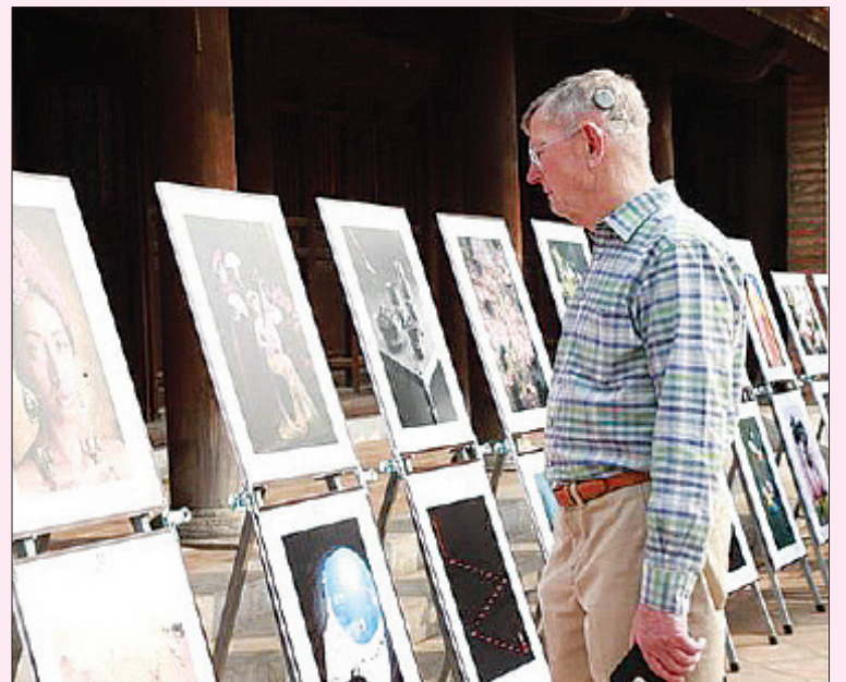
Du khách nước ngoài tham quan triển lãm.

Tại cuộc thi lần này, Việt Nam đã đạt được 45 giải thưởng trong số 71 giải thưởng của cuộc thi. Trong đó, có 4 tác giả Việt Nam giành Huy chương Vàng./.