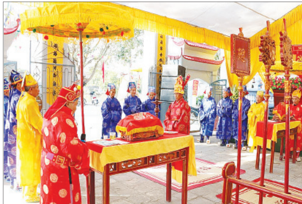
Lễ đón Bằng xếp hạng Di tích quốc gia ở làng Thi Liệu, xã Đại Thắng (Vụ Bản).