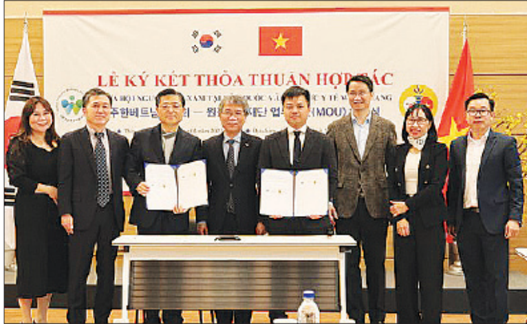
Lễ ký MOU hỗ trợ y tế cho cộng đồng người Việt Nam cư trú tại Hàn Quốc. Hwaseong, Iksan, Gunsan, Cheongju - cam kết giảm giá tối đa tới 50% chi phí dịch vụ y tế cho người Việt Nam đang cư trú tại Hàn Quốc; tích cực

Quốc sử dụng dịch vụ điều trị, tiểu phẫu, phẫu thuật, khám sức khỏe tổng quát; hợp tác kiểm tra sức khỏe cơ bản cho công dân Việt Nam tại Hàn Quốc.