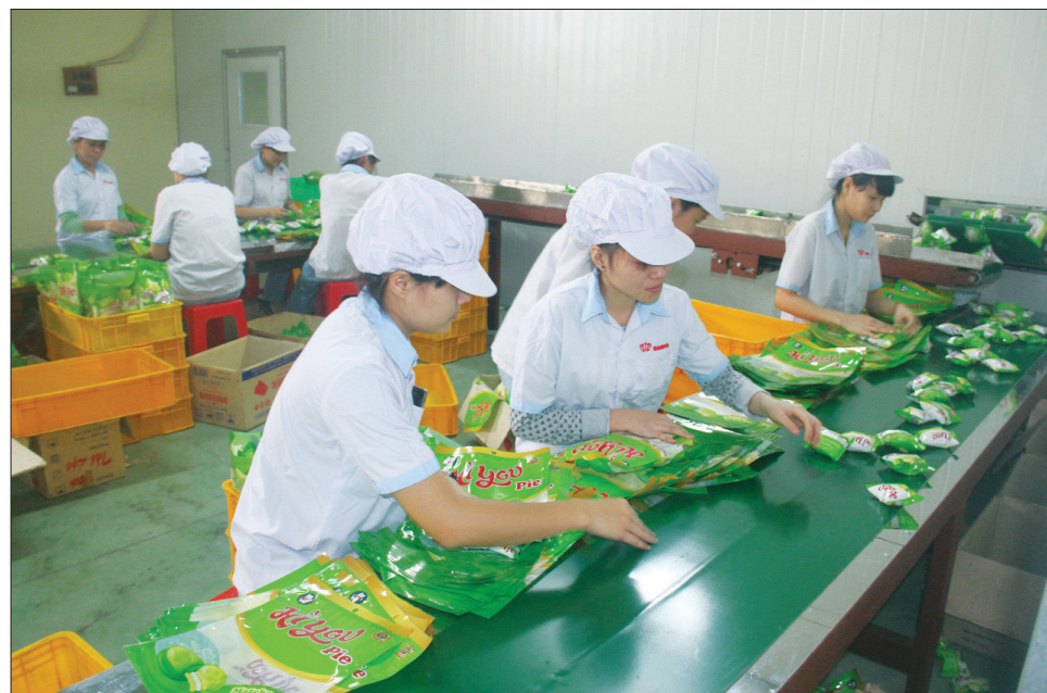
Sản phẩm bánh kẹo của Công ty TNHH Thương mại Hòa Bình (thành phố Nam Định).