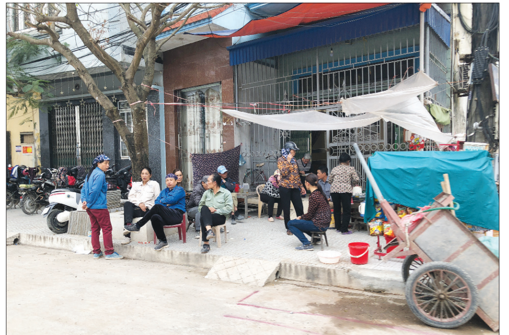
Những người lao động tự do ngồi chờ việc làm tại đường Trãn Nhân Tông (thành phố Nam Định).

Hiện nay, nhiều lao động tự do khác cũng đang phải "gồng mình" kiếm kế sinh nhai. Nghề nghiệp không ổn định, việc làm bấp bênh, thu nhập thấp, nên không được chi trả các chế độ phụ cấp, bảo hiểm xã hội... Mặc dù, chưa có con số thống kê chính xác về số lao động thời vụ đang có nhu cầu việc làm trên địa bàn tỉnh hiện nay, tuy nhiên, lao động thời vụ gặp khó khăn trong tìm kiếm việc làm thời gian qua rất rõ. Bởi những lao động ở độ tuổi ngoài 50 hầu hết chân tay chậm chạp, mắt kém, không có kỹ năng, tay nghề nên chỉ có thể làm những công việc ở các làng nghề, cơ sở sản xuất, kinh doanh nhỏ mang tính chất thời vụ hoặc lao động chân tay như dọn dẹp nhà cửa, phụ hồ, buôn bán nhỏ lẻ... mong cải thiện cuộc sống. Khi hết việc hoặc bán buôn không thuận lợi họ cũng phải đi tìm việc khác, công việc không liên tục ảnh hưởng