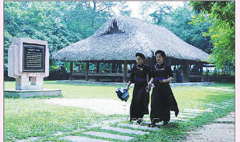
Đình Tân Trào.

Khu di tích lịch sử quốc gia đặc biệt Tân Trào nằm trong Khu ATK (An toàn khu), thuộc hai huyện Sơn Dương và Yên Sơn. Đây từng là địa bàn chiến lược quan trọng, nơi ở, làm việc của Chủ tịch Hồ Chí Minh, các đồng chí lãnh đạo cấp cao cùng nhiều cơ quan Trung ương trong thời kỳ tiền khởi nghĩa và thời kỳ kháng chiến chống thực dân Pháp.