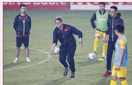
HLV Troussier phân tích tình huống cầu thủ chuyển bóng thiếu quan sát.

Một lợi ích khác của việc tập luyện vào buổi tối, đó là 41 tuyển thủ U.23 Việt Nam có thể ngủ sâu hơn, phục