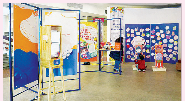
Không gian trưng bày tại Liên hoan.

Liên hoan sách hội ngộ những tác phẩm tôn vinh sự đa dạng, bình đẳng mà sách truyền đi trong suốt chiều dài lịch sử và cả mong ước tương lai. Liên hoan cũng thảo luận những xu hướng mới của sách và văn hóa đọc trong những năm gần đây như: nữ quyền, trao quyền, sách điện tử, sách nói, giáo dục giới tính... Đây là một hoạt động kỷ niệm Ngày Quốc tế Phụ nữ với chủ đề toàn cầu "DigitALL: Đối mới và công nghệ trong thúc đẩy bình đẳng giới", do Cơ quan Liên hợp quốc về bình đẳng giới và Trao quyền cho phụ nữ (UN Women) phối hợp Bảo tàng Phụ nữ Việt Nam, Eduforlife - dự án Sách ời mở ra cùng Trung tâm Đào tạo, Khoa học và Chuyển giao công nghệ (PowerAlive) tổ chức./.