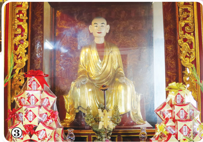
Bảo vật Quốc gia - Bộ tượng Trúc Lâm Tam Tổ đang được bảo quản, thờ tự tại Chùa Tháp Phổ Minh thuộc Khu Di tích Lịch sử quốc gia đặc biệt Đền Trần - Chùa Tháp, phường Lộc Vượng (thành phố Nam Định). Trong ảnh: Tượng Đức Phật hoàng Trần Nhân Tông (ảnh 1); Tượng Tổ Đệ nhị, Pháp Loa Thiên sư trong Bộ tượng Trúc Lâm Tam Tổ (ảnh 2); Tượng Tổ Đệ tam, Huyền Quang Thiên sư trong Bộ tượng Trúc Lâm Tam Tổ (ảnh 3).