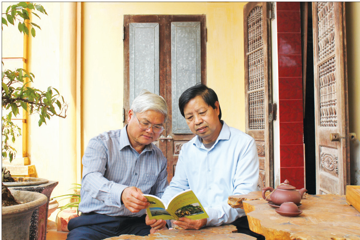
Hội viên câu lạc bộ thơ - văn Quần Phường trao đổi về thơ.